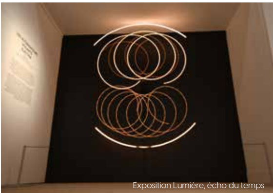
Exposition Lumière, écho du temps

● Mercredi 23 février, à 15 h et à 20 h 30, et vendredi 25 février, à 19 h Studio de danse du Manège La Roche-sur-Yon Tarifs surlegrandr.com