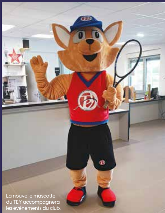
La nouvelle mascotte du TEY accompagnera les événements du club.

La soirée des étoiles du 4 décembre illustre la volonté de faire le lien entre les professionnelles et les adhérents, notamment les plus jeunes. C'est un moment de convivialité durant lequel le club se rassemble autour de l'équipe, avec des joueuses qui échangent des balles avec les licenciés. Cette année a une saveur particulière, avec un accueil dans un club-house entièrement rénové. De plus, un concours de dessins avait été lancé auprès des