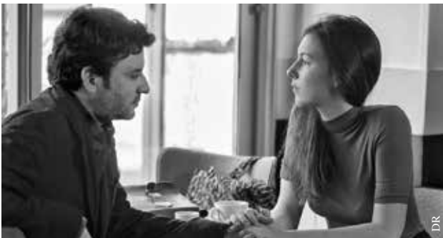
L'Amant d'un jour.

Film d'Agnès Varda et JR présenté au 70 e Festival de Cannes.