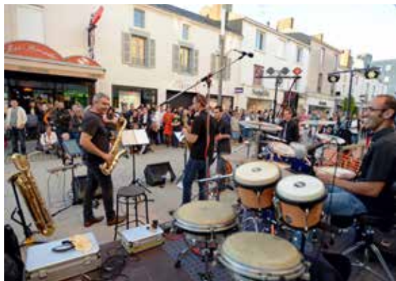
La musique investit les rues de La Roche-sur-Yon.

Besoin d'une pause fraîcheur ? Le Monde des Barons perchés vous accueille toute la journée dans son espace détente sur la place Napoléon.