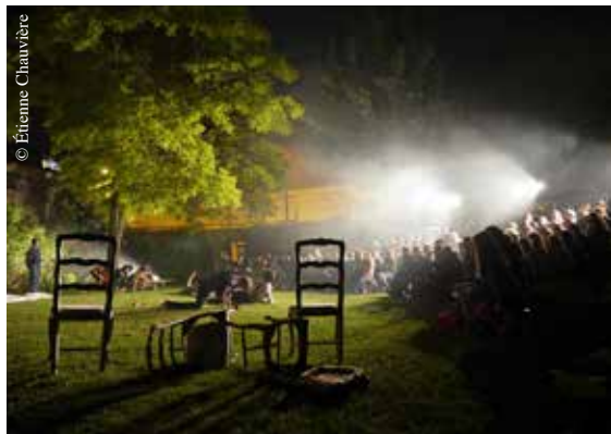
Les Z'Ateliers au jardin des Compagnons.

Avec le soutien technique du Grand R Scène nationale et de la Ville de La Roche-sur-Yon.