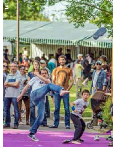
Participez au lancer de tongs !

Plus d'informations sur www.paytatong.com .