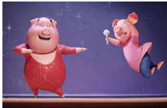
Tous en scène.

Film d’animation (dès 6 ans) de Garth Jennings – 2016 – 1 h 50. Buster Moon est un élégant koala qui dirige un grand théâtre, jadis illustre, mais aujourd’hui tombé en désuétude. C’est alors qu’il trouve une chance en or pour redorer son blason tout en évitant la destruction de ses rêves et de toutes ses ambitions : une compétition mondiale de chant ! Ciné goûter (en version française) le mercredi 22 février, à 14 h 30.