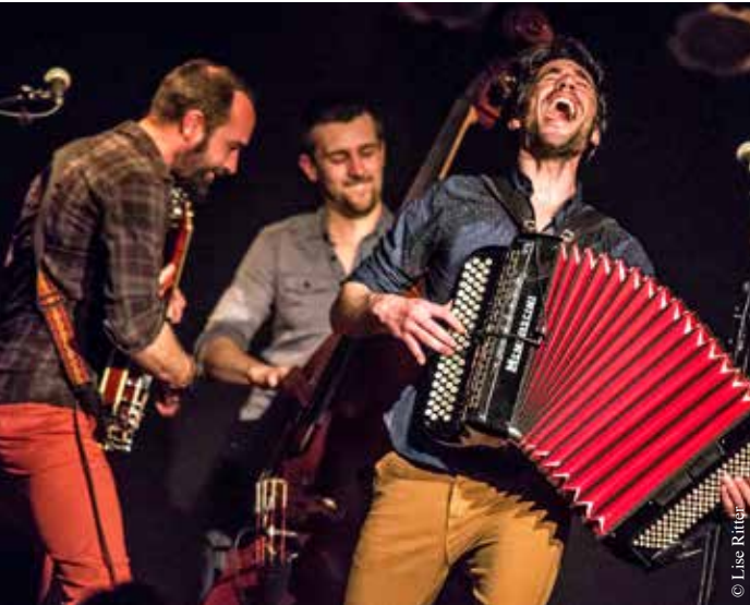
Le Syndrome du chat, trio.

L'association Chants-Sons organise la 23 e édition du festival Chant'Appart.