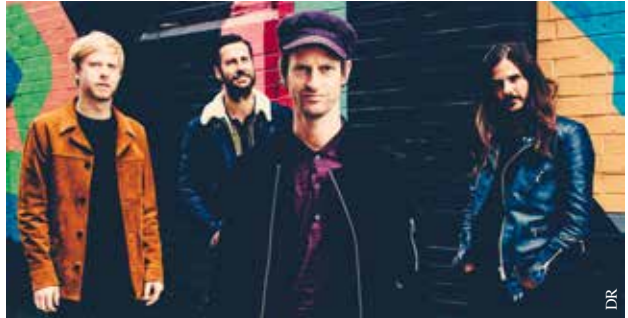
The Temperance Movement (blues rock) le vendredi 27 janvier à La Roche-sur-Yon.

Souvent présenté comme le meilleur groupe rock émergent en Grande-Bretagne, The Temperance Movement nous revient avec un nouvel album, White Bear , sorti en janvier 2016. Leur premier album éponyme en 2013 a été classé douzième aux charts britanniques en seulement trois mois ! Le groupe a ensuite enchaîné les concerts complets et a aussi joué en première partie des Rolling Stones en 2014 en Europe, puis en Amérique du Nord en 2015 ! Il n'y a pas de demi-mesure avec The Temperance Movement. Malgré la frénésie des tournées, le groupe a trouvé le temps d'écrire et d'enregistrer son nouvel album