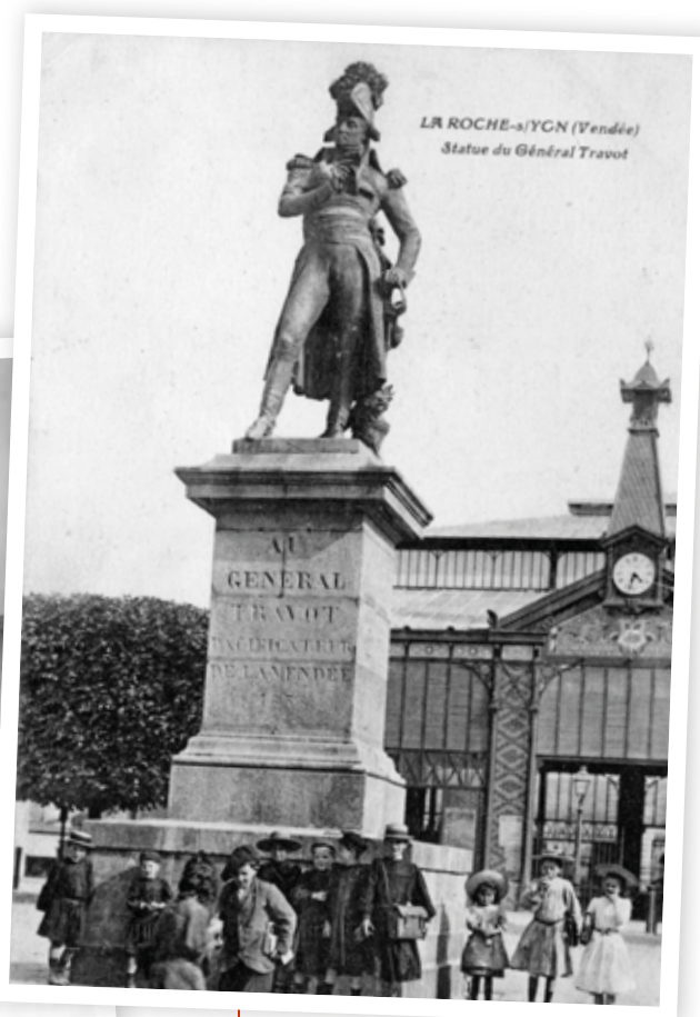
La statue de Travot devant les halles vers 1900