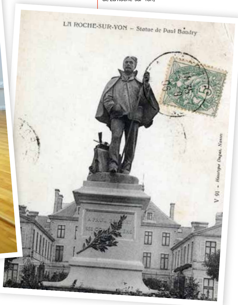
La statue de Baudry devant la préfecture vers 1900 (collection Archives municipales de La Roche-sur-Yon)