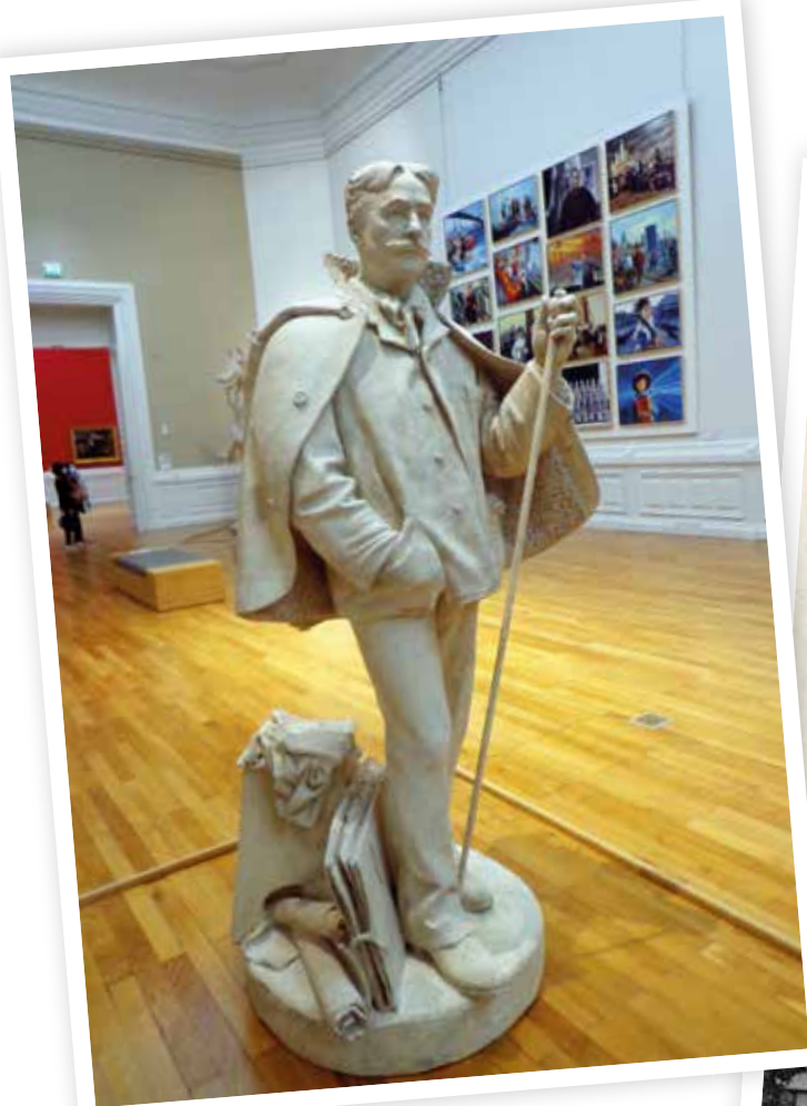
Le plâtre de la statue de Baudry actuellement au musée d'Art de Nantes.

Dès lors, l'unique vestige des « trois disparues » de La Roche-sur-Yon est le plâtre de Baudry, offert par Jean-Léon Gérôme à la Ville de Nantes (1898). Il est aujourd'hui présenté dans son musée d'Art.