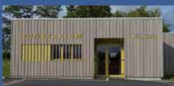
« ZA Le Lumeau » Dompierre-sur-Yon