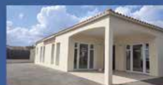
« Impasse des tourterelles » Le Champ St Père