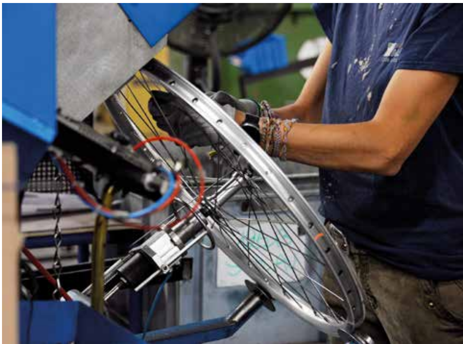
Arcade Cycles assemble 60 000 vélos par an.