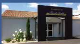
« Route de Luçon » Saint Florent des Bois