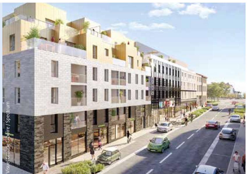
Visuel Groupe Giboire / Spectrum

Il comprendra une grande salle de 213 places dotée d'un écran de 12 mètres et d'un son Atmos à 360°, qui permet de placer le spectateur au cœur de l'action. Trois autres salles de 89, 64 et 53 places seront équipées d'un écran de 8 mètres et d'un son dolby 7.1. Au-delà de la projection numérique, deux des quatre salles auront la possibilité de projeter des films en 35 millimètres.