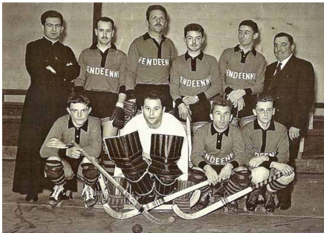
En 1962, l'équipe de La Vendéenne championne de France et accède à la Division 1.

Des anciens joueurs qui s'investissent dans le club, un esprit de solidarité, l'envie de gagner et d'aller toujours plus haut, la formation des jeunes, sont sans aucun doute les ingrédients de la longévité et de la réussite. « La Vendéenne m'a apporté les titres et le haut niveau. Mais c'est surtout