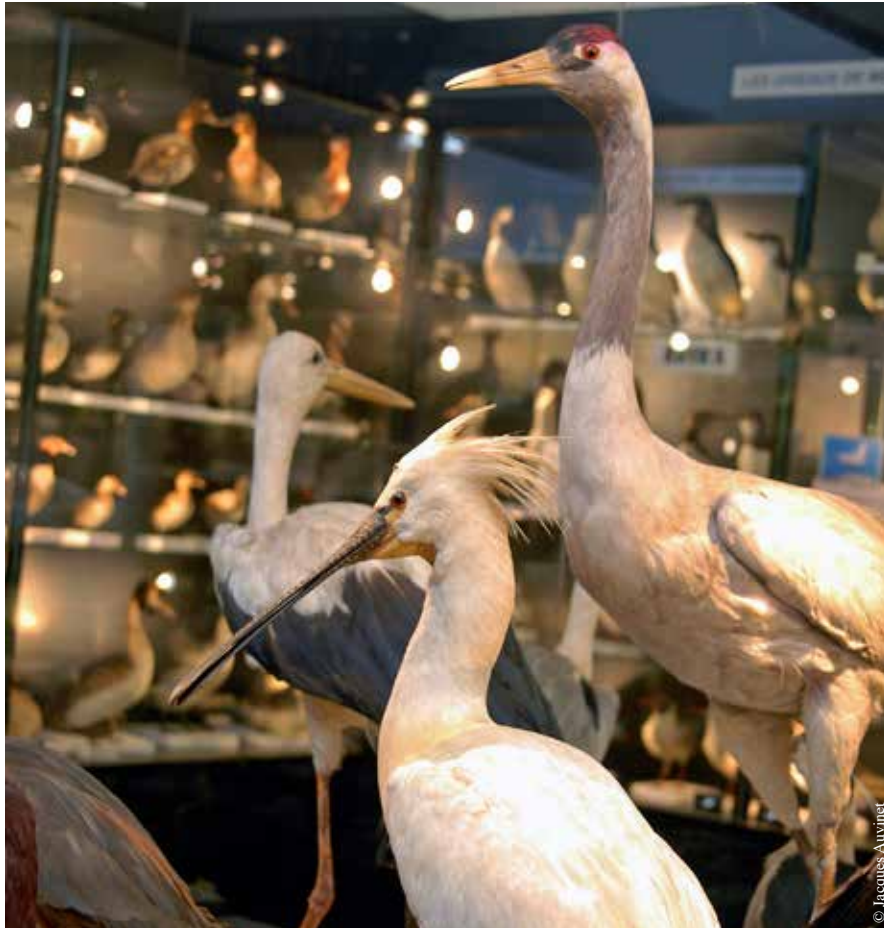
Les collections d'oiseaux de Charles-Payraudeau.

Le Musée ornithologique Charles-Payraudeau (1798-1865) à La Chaize-le-Vicomte conserve les collections du grand naturaliste vicomtais cédées à la commune en 1868.