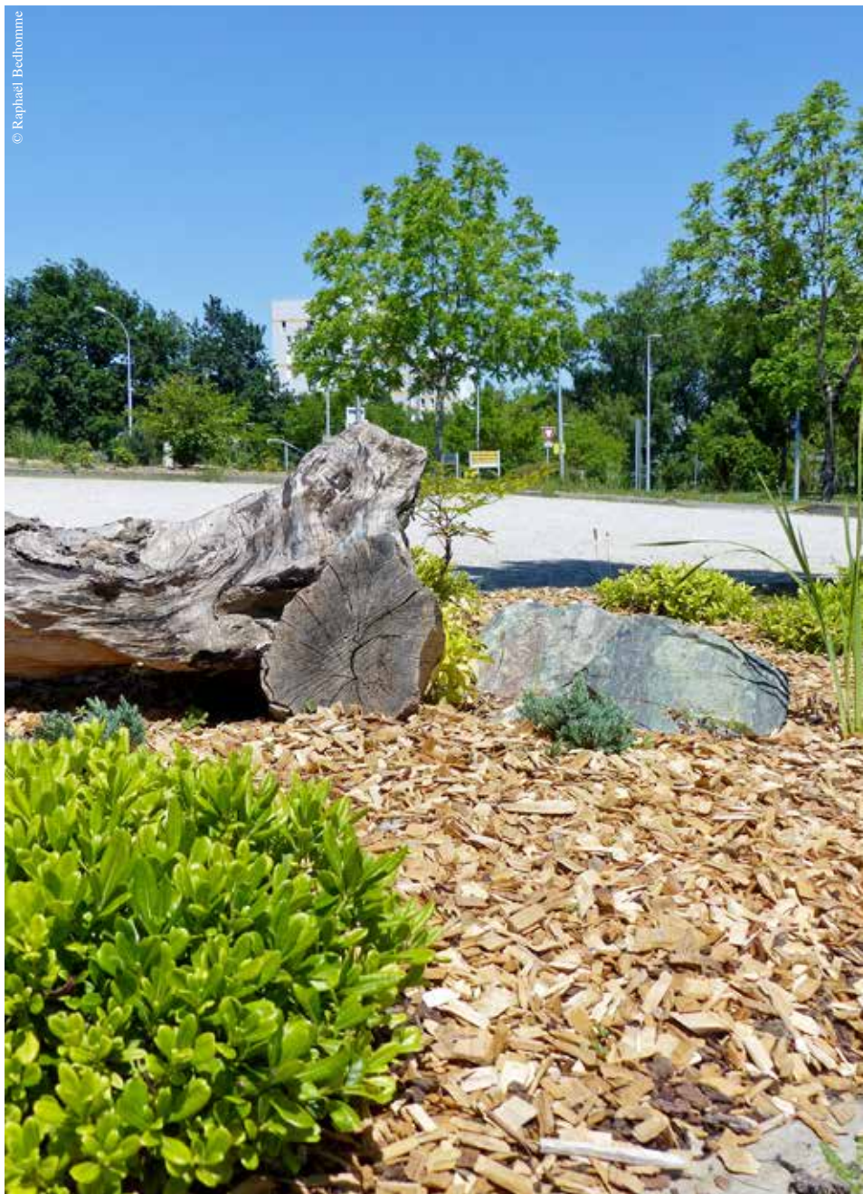
Un paillage protège le sol des rayons du soleil et limite ainsi l'évaporation naturelle de l'eau.

Avec seulement 3 % d'eau douce disponible à l'échelle du globe, chaque goutte est comptée, alors n'utilisez pas l'eau du robinet et pensez à récupérer l'eau de pluie, généralement de qualité suffisante pour un arrosage. Stockez-la dans un tonneau, un récupérateur ou toute autre citerne recouverte pour limiter l'évaporation.