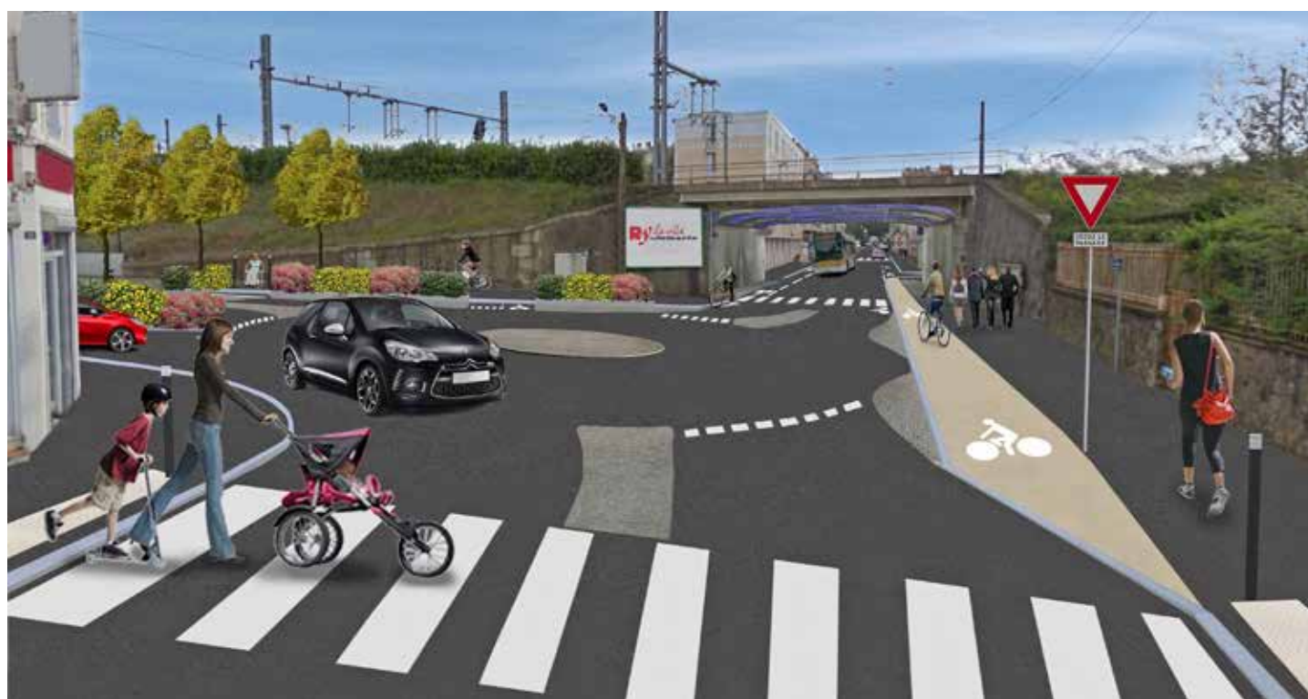
Le futur giratoire situé entre la rue Salengro et le boulevard Leclerc.

Depuis février, la Ville de La Roche-sur-Yon entreprend des travaux d'embellissement du boulevard Louis-Blanc, de la rue Poincaré et de la place de la Vendée. Objectifs : rendre plus lisible le partage de l'espace public entre piétons, vélos, bus et voitures pour une meilleure sécurité des usagers. Les réseaux aériens seront également effacés et des aménagements paysagers seront réalisés.