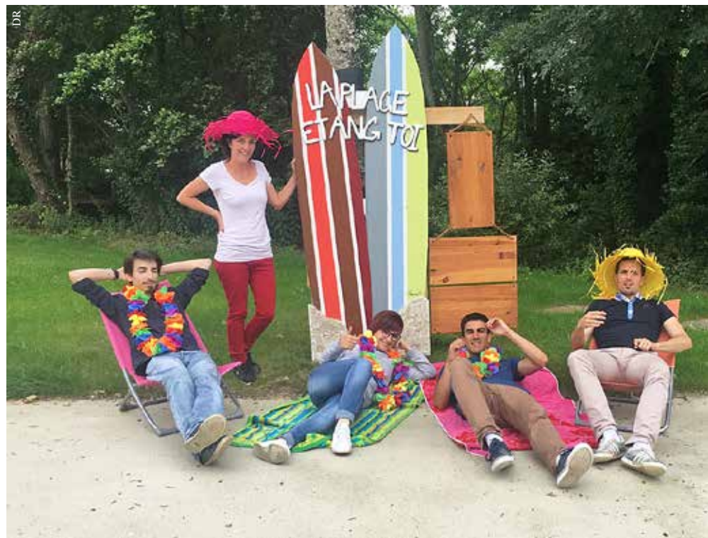
Venansault vous invite à la plage !