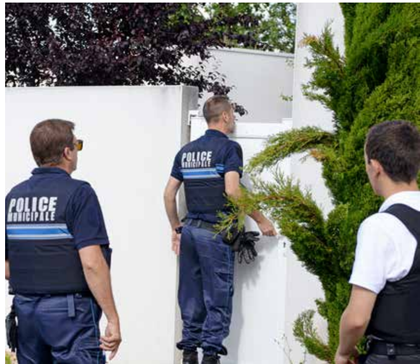
En votre absence, les forces de l'ordre surveillent votre habitation.

Police municipale de La Roche-sur-Yon, 1 bis, place du Marché, au 02 51 47 47 00. Brigade de gendarmerie de La Roche-sur-Yon, 31, boulevard Maréchal-Leclerc, au 02 51 45 19 00.