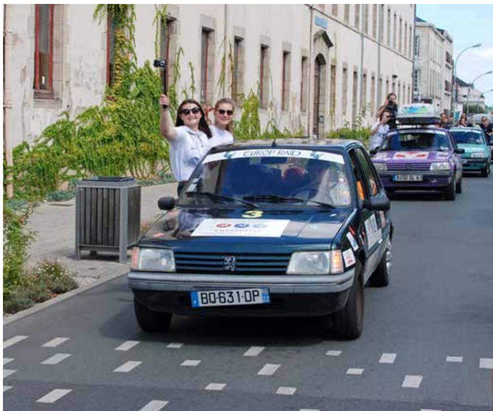
Comme aux éditions précédentes, les équipages de l'Europ'Raid célébreront leur retour sur la place Napoléon.

Contact : organisation@europraid.fr et www.europraid.fr