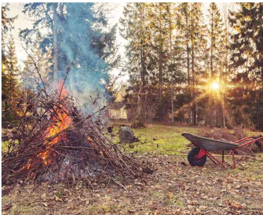
Le brûlage en incinérateur ou à l'air libre des déchets verts est interdit.