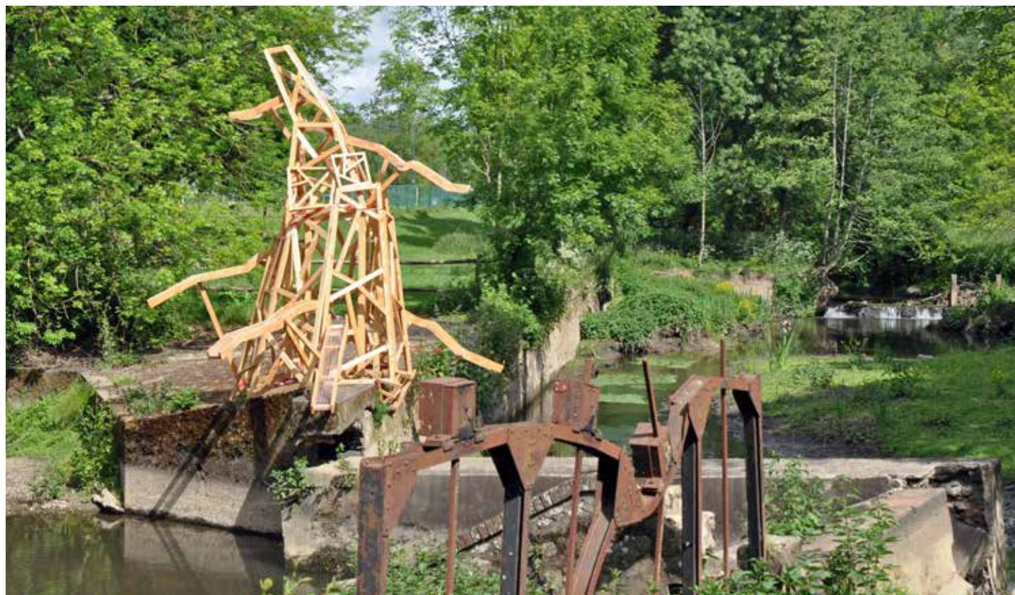
Le Pipelife, belvédère et structure d'eau sur le site Rivoli.

La balade sera prochainement accessible via l'application Baludik de l'Office de tourisme de La Roche-sur-Yon Agglomération. Chacun pourra ainsi être guidé le long de l'Yon et toucher du doigt la mémoire du Pont-Rouge à Alluchon.