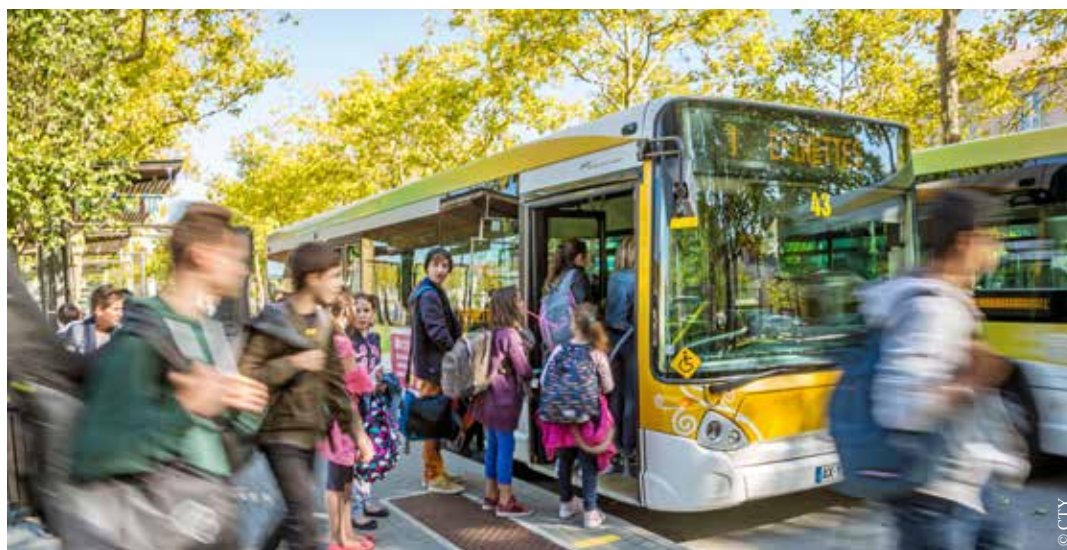
Faciliter les déplacements de tous les Agglo-Yonnais, tel est l'objectif de La Roche-sur-Yon Agglomération.

Un nouveau véhicule viendra compléter le parc actuel aux heures de pointe.