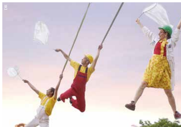
La compagnie Les Sanglés et leur brigade de dépollution.