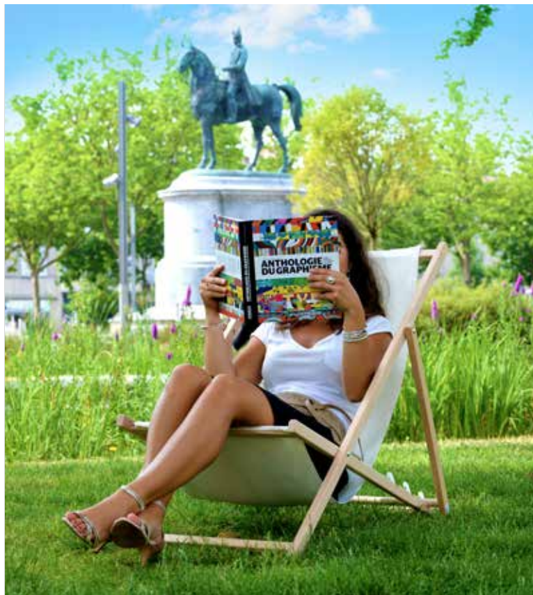
Comme en 2016, la bibliothèque éphémère est installée sur la place Napoléon.