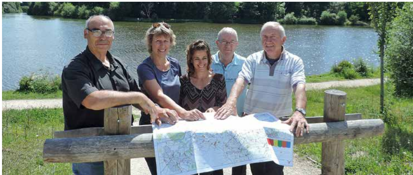
Les bénévoles ont sillonné tous les sentiers de la commune de La Ferrière pour réaliser le guide des randonnées.

La commune de La Ferrière vient de recenser 34 nouveaux sentiers de promenade sur son territoire et prépare un guide qui sera distribué à la rentrée.