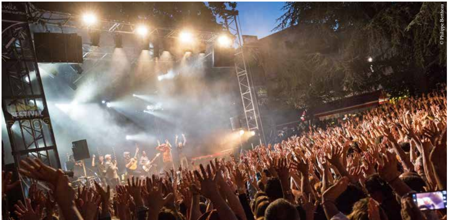
16 300 spectateurs ont assisté au festival R.Pop en 2016.