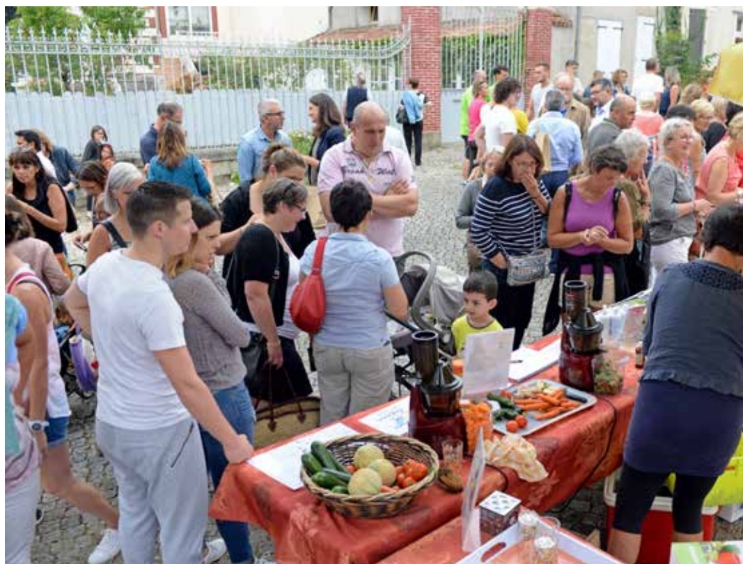
Bio dimanche sur la place de la Vieille-Horloge à La Roche-sur-Yon.

Démonstration de dentellières et/ou tailleurs de pierre.