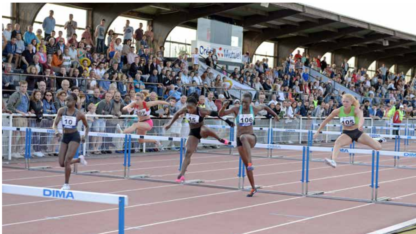
Le Meeting de La Roche-sur-Yon promet encore du grand spectacle.

L'Athletic club La Roche-sur-Yon (ACLR) vous donne rendez-vous pour son Meeting N1 le mercredi 5 juillet, à partir de 18 h, au stade Jules-Ladoumègue de La Roche-sur-Yon. Entrée gratuite.