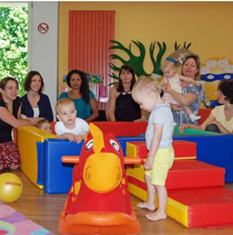
Les Ribambelles, un espace pour les familles.

Contact : mairie annexe de Saint-André d'Ornay – La Roche-sur-Yon, au 02 51 37 49 96