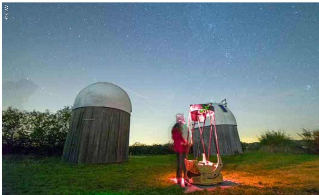
Les étoiles sont plus belles au Tablier !

Contact : Centre astronomique vendéen, au 02 51 37 34 10, à richard.tanguy2@sfr.fr et sur www.astrovendee.fr