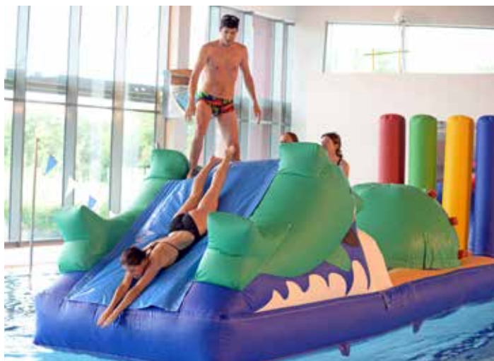
Venez profiter de la structure gonflable géante à la piscine sud.

- stages multi-activités aquatiques pour les enfants sachant déjà nager (50 m : 25 m sur le ventre + 25 m sur le dos). Objectif : découverte de nouvelles pra-