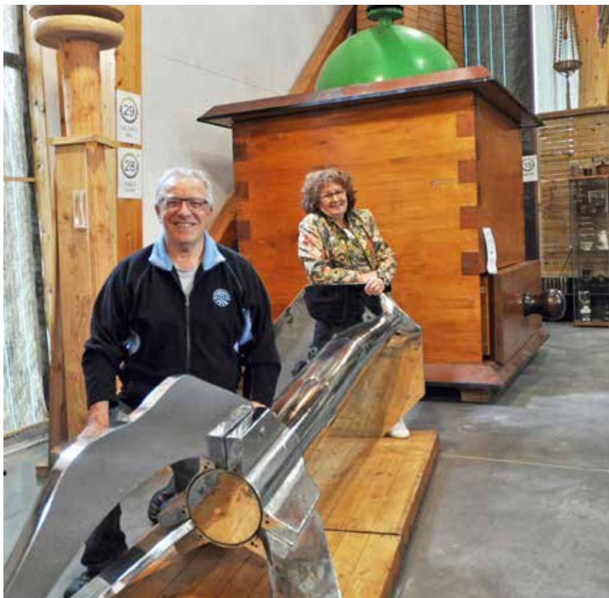
Partez à la découverte d'objets XXL.

Contact : Espace des Records, 16, rue Jules-Verne, Aubigny – Aubigny-Les Clouzeaux, au 02 28 15 50 63, à accueil@espacedesrecords.fr et sur www.espacedesrecords.com