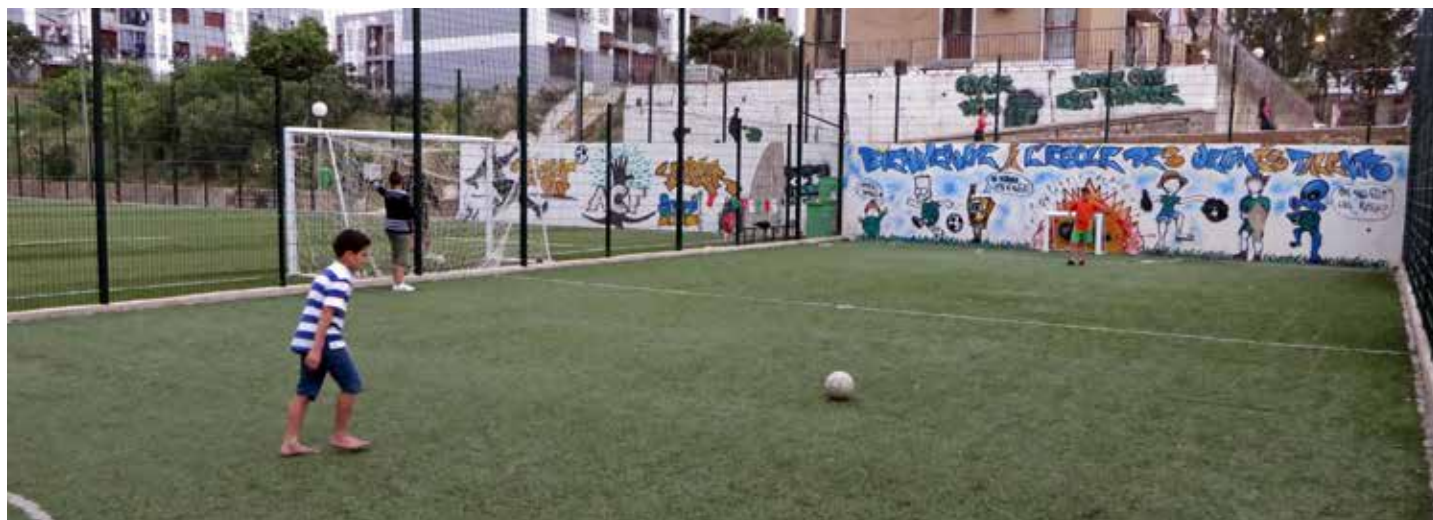
Aménagement de loisirs dans le quartier des Fonctionnaires à Tizi Ouzou.

Début mai, l'association yonnaise Algérie France Amitié (Alfa) était elle aussi sur place pour un séjour découverte avec les mêmes objectifs de mieux se connaître et de renforcer les liens entre nos populations.