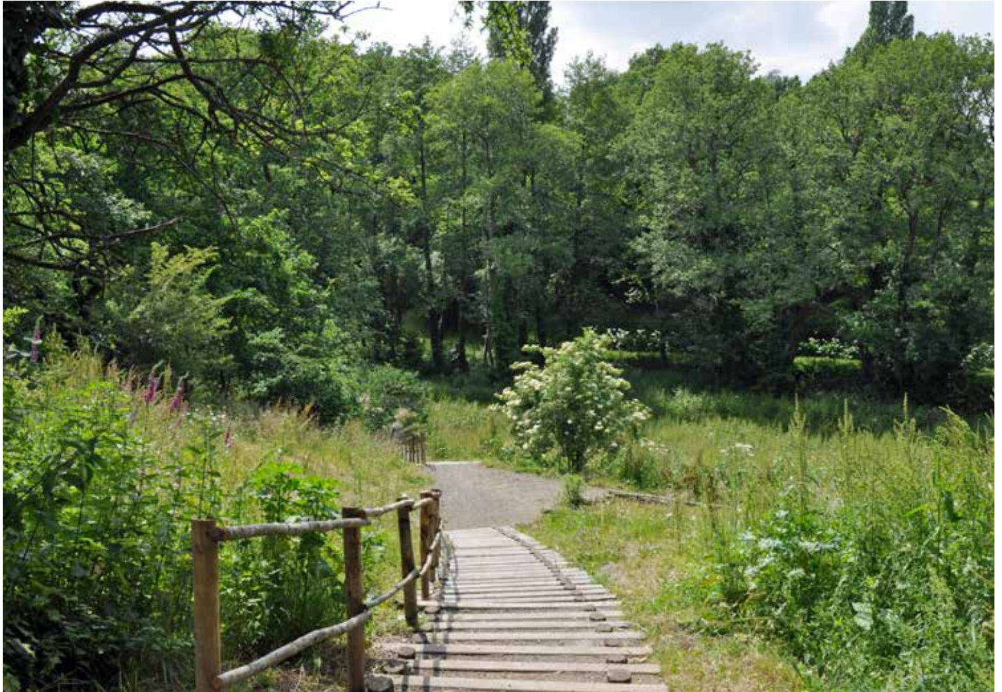
La vallée de Margerie, un site que certains disent peuplé par les fées, les elfes, les fradets et les farfadets.

Créée il y a deux ans par la municipalité de Dompierre-sur-Yon, soutenue par un programme spécifique financé à hauteur de 160 000 euros par l'Europe et la région des Pays de la Loire, la vallée de Margerie s'étend au centre-bourg et se poursuit jusqu'aux étangs de Malvoisine.