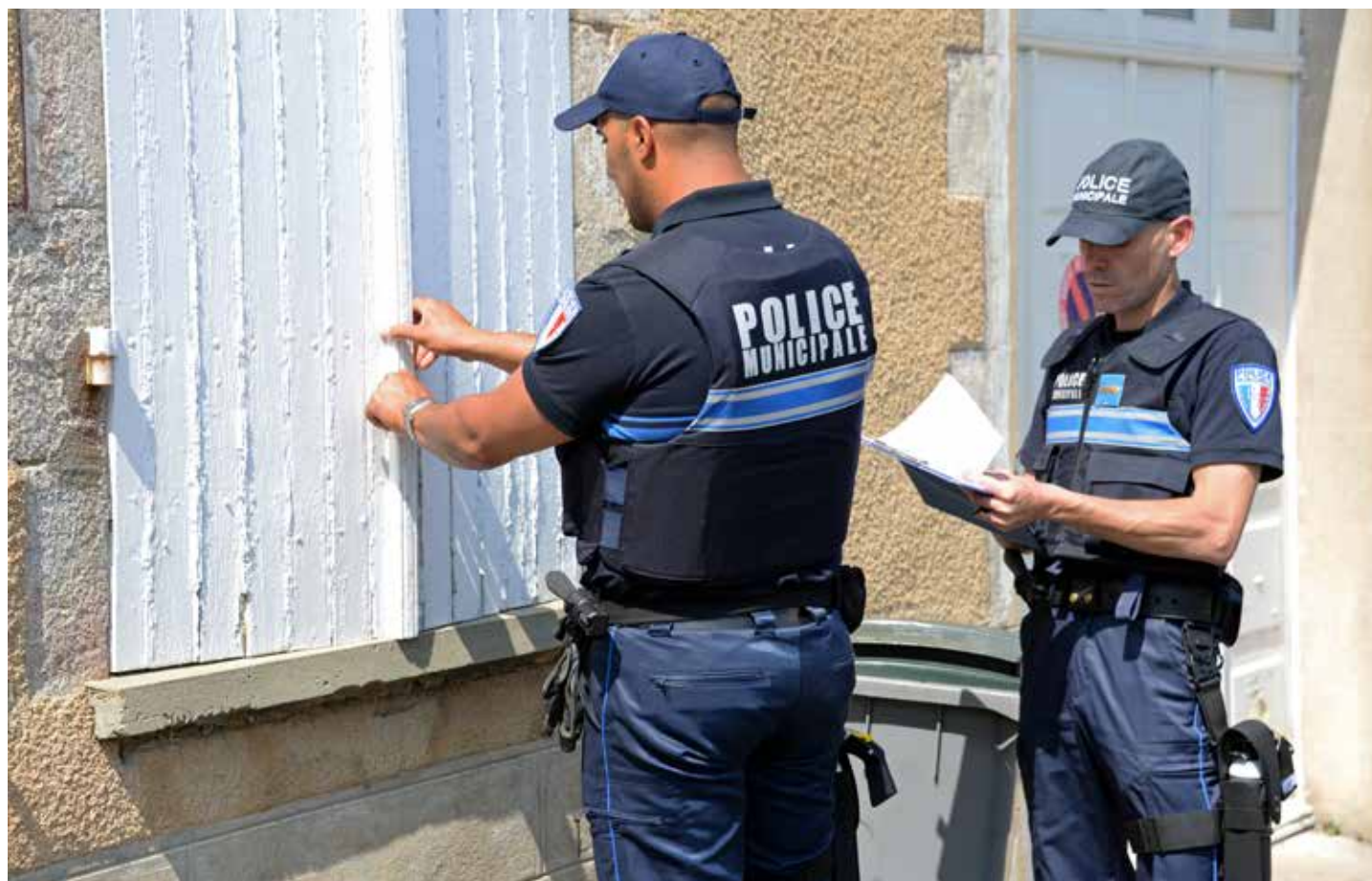
Une présence renforcée de la Police municipale de La Roche-sur-Yon pendant vos vacances.

Brigade de gendarmerie de La Roche-sur-Yon, 31, boulevard Maréchal-Leclerc, au 02 51 45 19 00