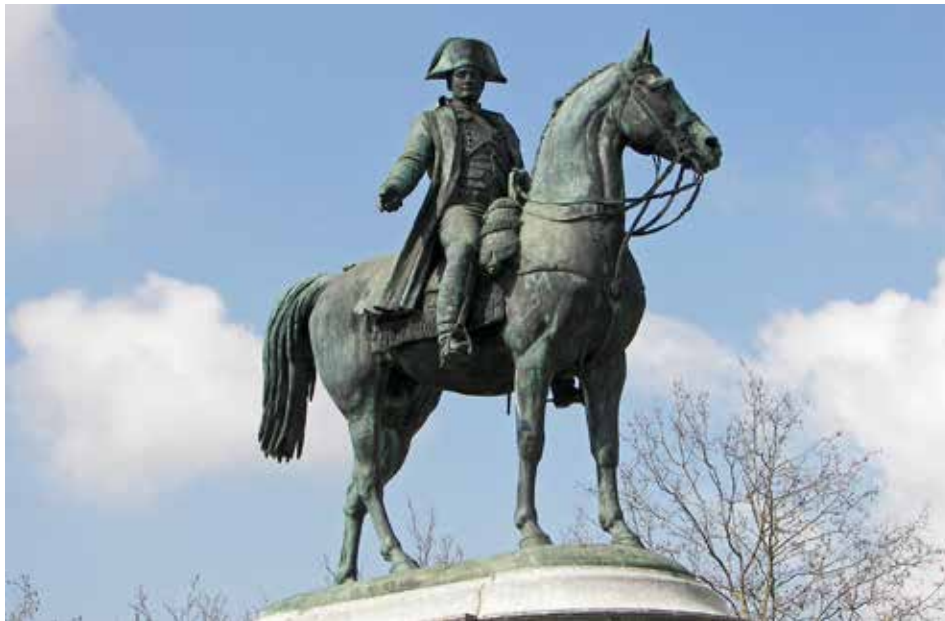
Du haut de cette statue, près de deux siècles vous contemplez.

Érigée en 1854 sur la place centrale à l'occasion du cinquantenaire de la fondation de la ville, la statue équestre de Napoléon I er à La Roche-sur-Yon vient d'être inscrite au titre des monuments historiques par la Direction régionale des affaires culturelles.