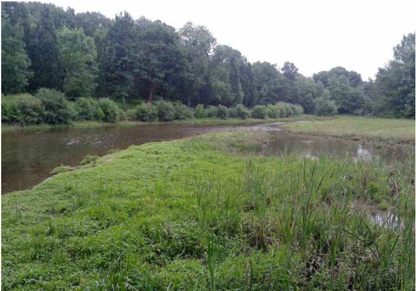
L'étang d'Alluchon se dévoile sous un nouveau jour : l'Yon a repris son cours naturel, les berges se sont végétalisées et les poules d'eau y ont élu domicile.

Le site de l'étang d'Alluchon à La Roche-sur-Yon a connu des dégradations suite aux intempéries de l'hiver 2014-2015. Le plan d'eau s'est vidé, mais la nature reprend son cours progressivement et son réaménagement est à l'étude.