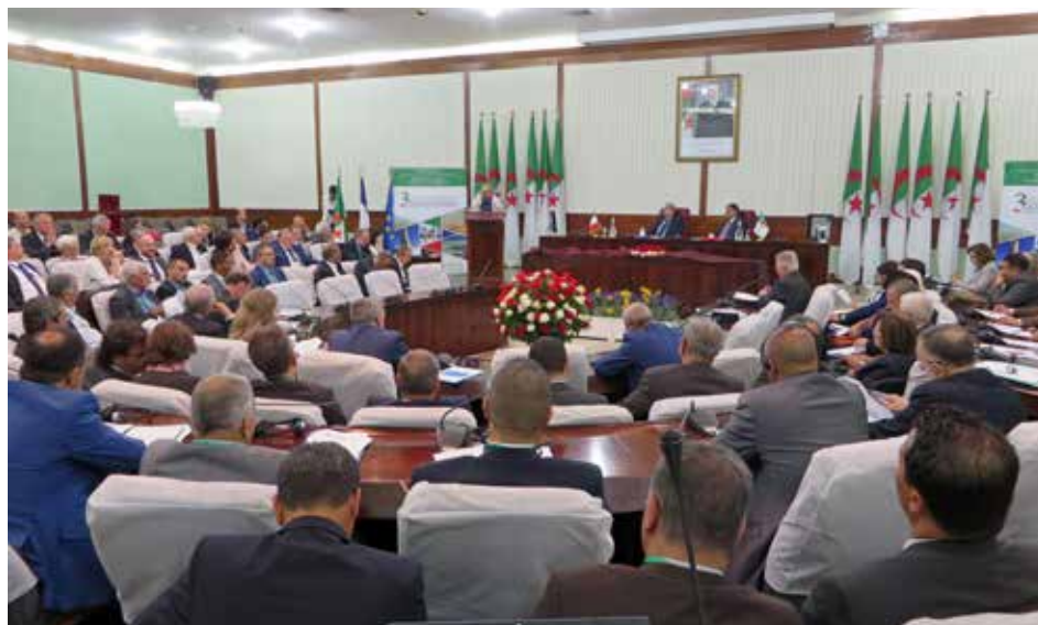
Les Rencontres algéro-françaises des maires et présidents des collectivités territoriales.