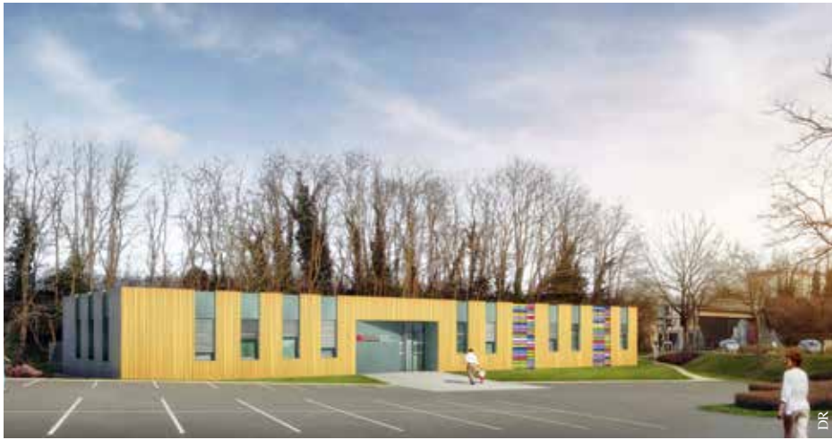
La maison de santé est installée au 69, boulevard Edison, à proximité du magasin Intermarché.

Portée par la Ville de La Roche-sur-Yon, une maison de santé pluriprofessionnelle ouvre ses portes le 1 er septembre dans le quartier des Forges.