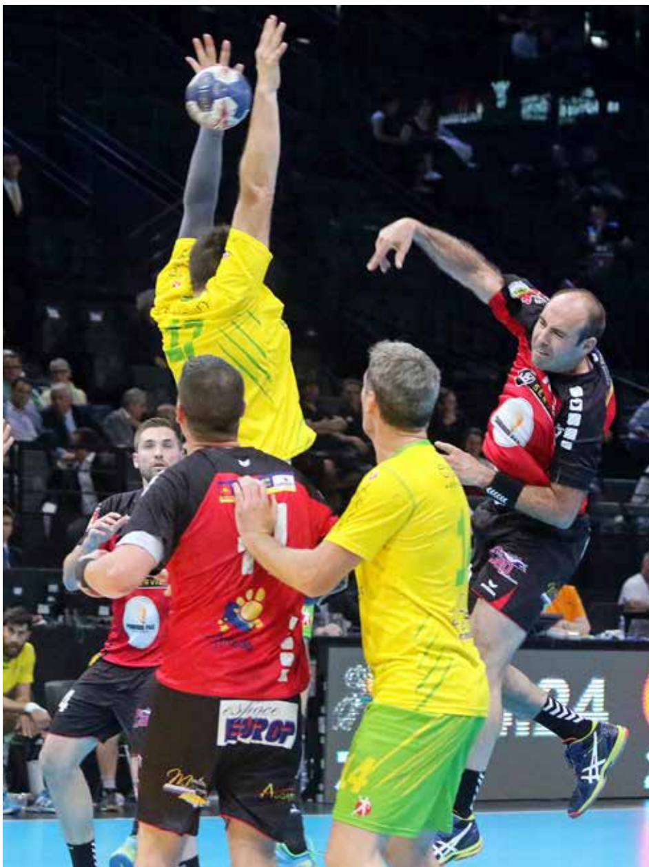
Le SLAM a affronté l'équipe de Guilherand-Granges en finale de la Coupe de France régionale 2016.