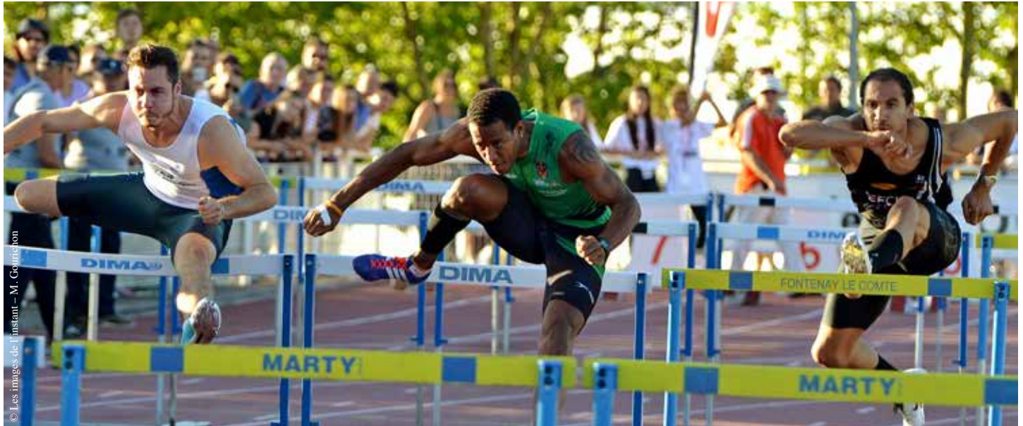
Le Meeting de La Roche-sur-Yon attire chaque année des athlètes de haut niveau.

L'Athlétic club La Roche-sur-Yon (ACLR) organise son Meeting élite le mercredi 13 juillet, à partir de 18 h, au stade Jules-Ladoumègue.