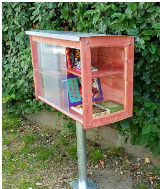
Des boîtes à livres sur l'espace public.