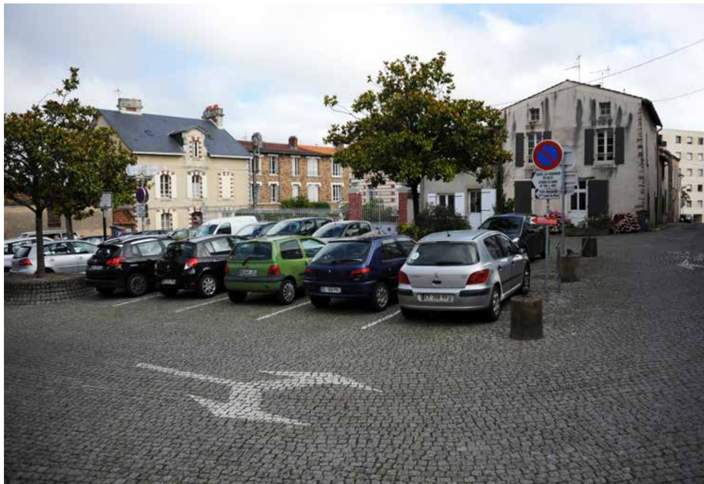
La place de la Vieille-Horloge accueillera un marché bio tous les dimanches matins.

À partir du 4 septembre, profitez du nouveau marché bio tous les dimanches matin à La Roche-sur-Yon.