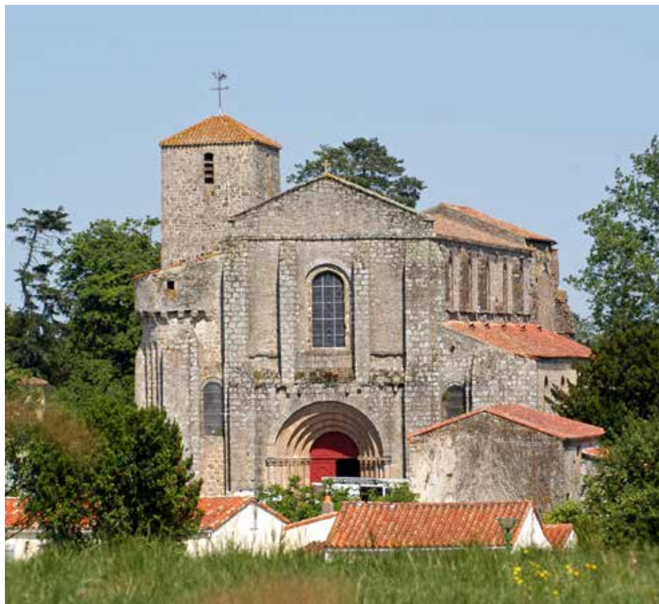
L'église Saint-Nicolas a été classée monument historique le 9 septembre 1908.