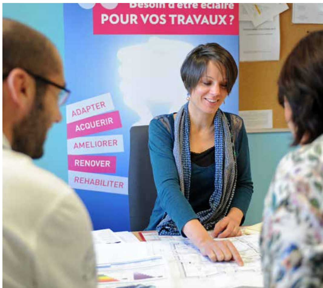
Le Guichet unique de l'habitat de La Roche-sur-Yon Agglomération vous accompagne dans votre projet.