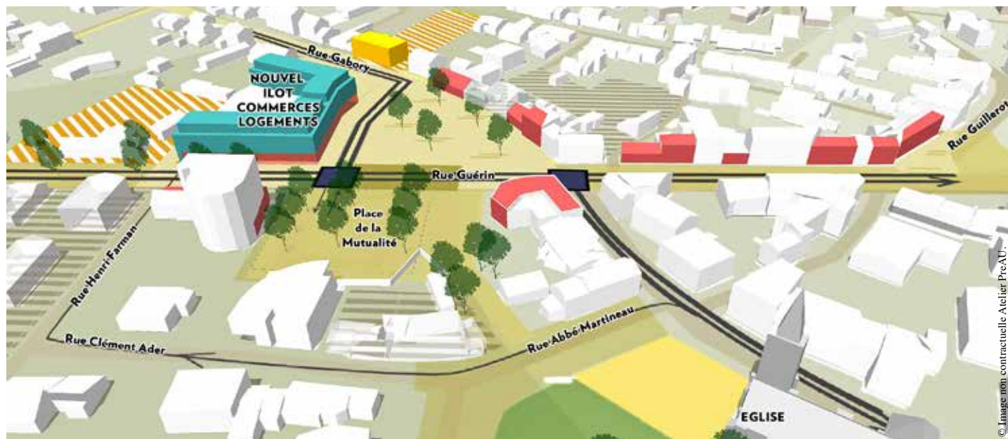
Vue sur les futurs aménagements du Bourg-sous-La Roche.

Près de 300 habitants ont participé le 17 mai dernier à la réunion publique de présentation du projet de réaménagement du Bourg-sous-La Roche organisée par la Ville. Objectifs : renforcer l'attractivité commerciale et l'offre de logements, améliorer la circulation automobile et piétonne, faciliter le stationnement et embellir le centre