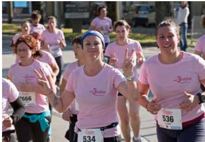
La Joséphine : défi sportif et solidaire.

L'événement est entièrement financé par les inscriptions et le soutien de partenaires (Ligue contre le cancer, Decathlon, société TIP La Roche-sur-Yon, Caisse primaire d'assurance maladie de la Vendée et Les Opticiens mutualistes).