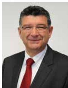
Luc BOUARD Président de LA ROCHE-SUR-YON AGGLOMÉRATION Maire de LA ROCHE-SUR-YON