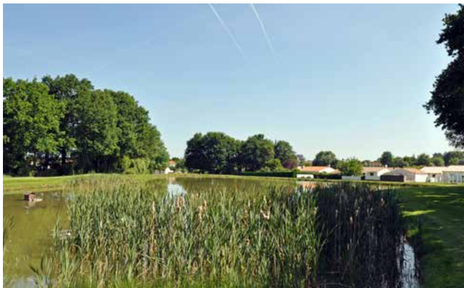
Le sentier du chemin de ronde vous emmène vers l'étang communal.

Pratique : plus d'informations sur www.fougere.fr