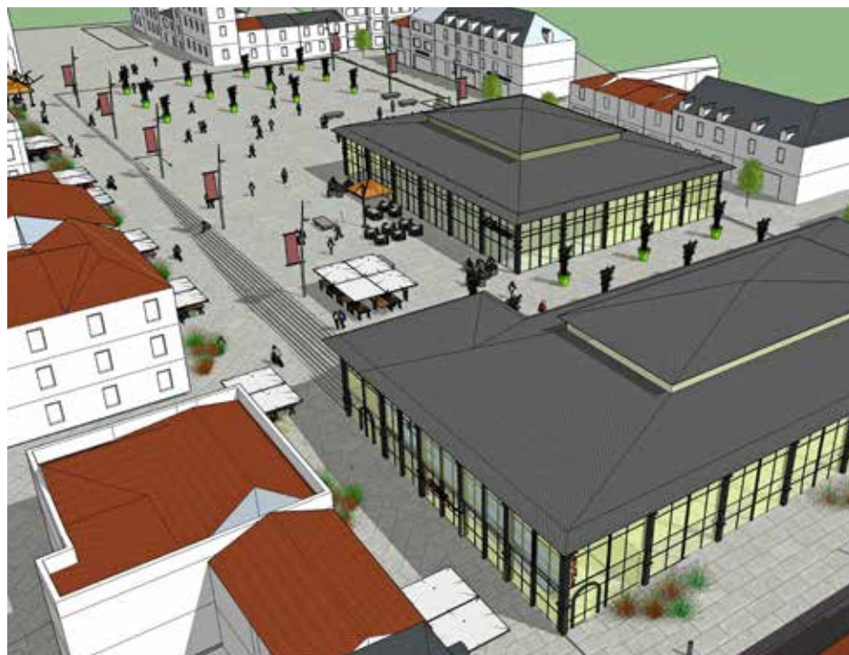
Vue sur le futur parvis des halles de La Roche-sur-Yon. Le visuel reflète l'ambiance générale souhaitée par la municipalité et ne représente pas le projet architectural final.

Internet de la ville, sur les aménagements et ambiances attendus dans le futur quartier des halles. Parmi les éléments à retenir, on notera un intérêt fort pour une piétonnisation du quartier, une attente d'éléments végétaux et de la présence d'eau, de jeux et équipements ludiques ainsi que des espaces de repos et de détente. Les résultats complets de cette enquête seront transmis au bureau de maîtrise d'œuvre en charge de la réhabilitation des espaces publics afin de répondre au mieux aux attentes des habitants.