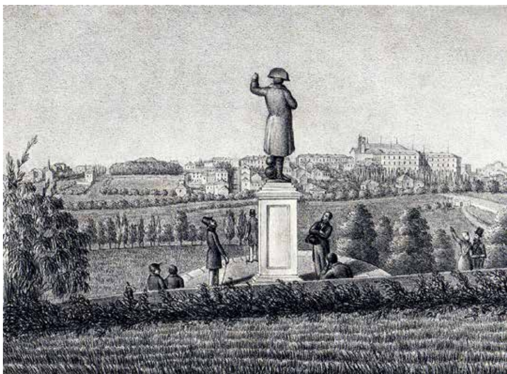
Gravure « Vue de Bourbon, prise du Coteau Napoléon ». (Bourbon-Vendée est l'ancien nom de La Roche-sur-Yon.)

Cette statue a aujourd'hui disparu, mais il en existe une représentation sur une gravure de 1844 intitulée « Vue de Bourbon, prise du Coteau Napoléon » dessinée par Gibert et imprimée chez Charpentier à Nantes.