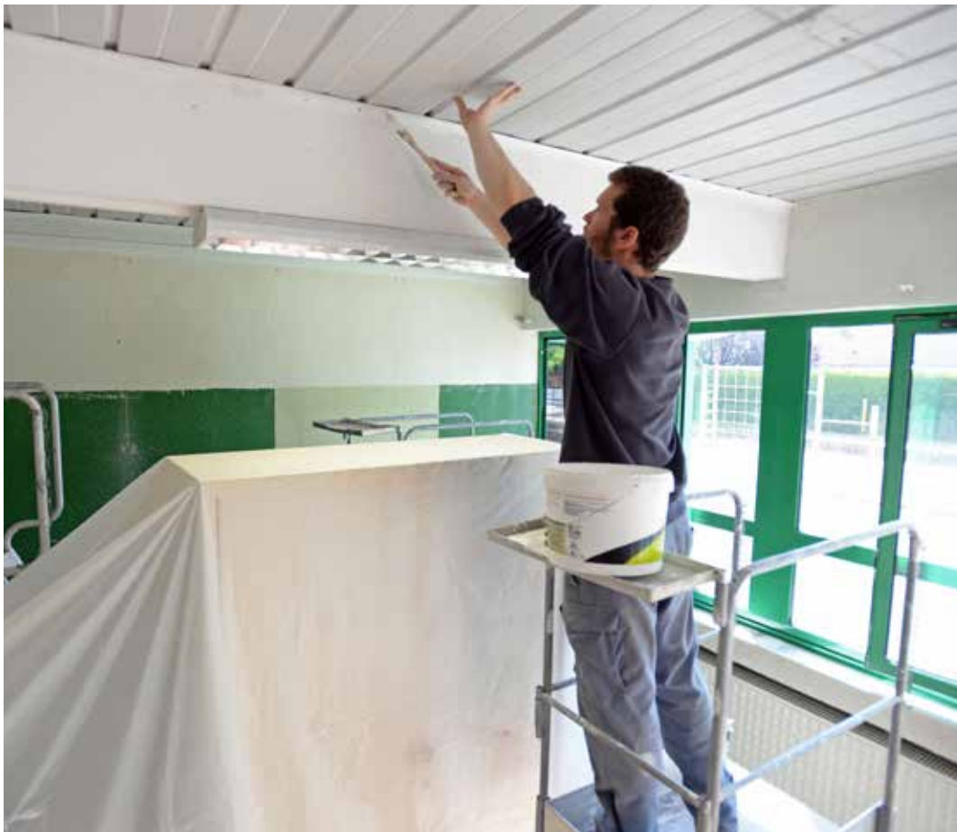
Les travaux de l'école élémentaire de La Généraudière sont réalisés par le chantier collectif de la Ville de La Roche-sur-Yon.

« Dans le cadre des travaux de sécurisation des accès aux écoles, tous les établissements devraient être équipés de visiophones en septembre, souligne Marc Racapé. Des études sont également en cours pour l'agrandissement du restaurant scolaire Montjoie et la construction de deux salles d'activités auxquelles notamment les directeurs seront associés, car ces travaux impacteront l'accès au groupe scolaire. Ce sera également le cas à l'école élémentaire Laennec dans le cadre de la reconstruction de l'école et de la construction d'un ascenseur en projet pour 2017. »