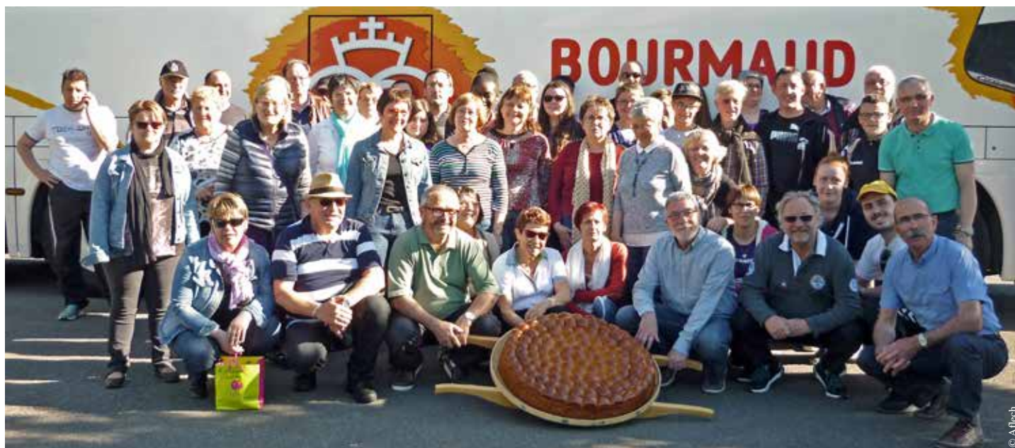
Une délégation ferriéroise de l'Aflech s'est déplacée à Wandlitz en mai dernier.

Rives de l'Yon accueille les Allemands de Röthenbach du 22 au 27 août. Cette ville se situe en Bavière à 1 100 km de Saint-Florent-des-Bois. Les deux communes sont jumelées depuis 1989.