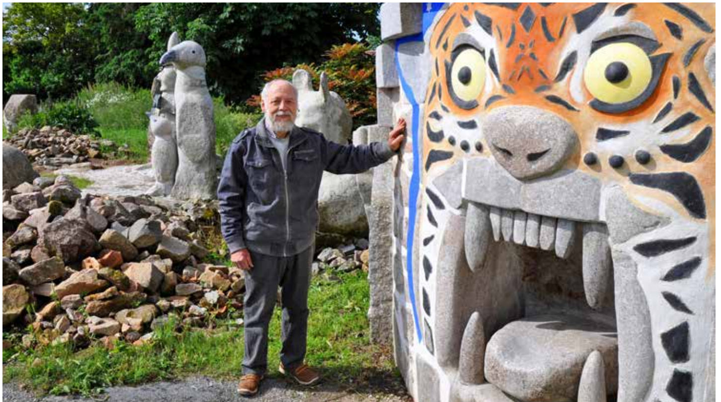
Le tigre de pierre, un des éléments de la création de Gildas Raineau.

Gildas Raineau n'hésite pas à partager son savoir-faire au cours d'ateliers pour les enfants ou les adultes. Il suffit de lui demander !