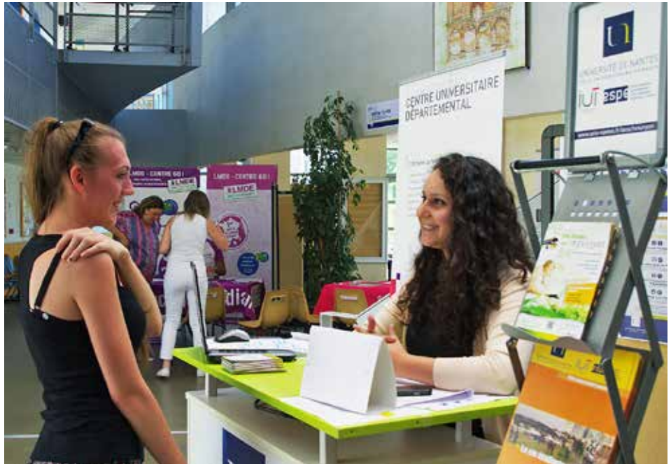
L'université de Nantes à La Roche-sur-Yon propose un accueil personnalisé.

Licences générales du 6 au 15 juillet, de 9 h à 12 h et de 13 h 30 à 17 h, bâtiment E (faculté de droit et faculté des langues et cultures étrangères) ; DUT à partir du 11 juillet, bâtiment B (IUT).