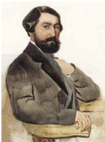
Alfred Émilien O'Hara, comte de Nieuwerkerke, créateur de la statue équestre de La Roche-sur-Yon.

152 communes vendéennes et de l'administration des Beaux-Arts permettront de boucler le budget de 57 000 francs.