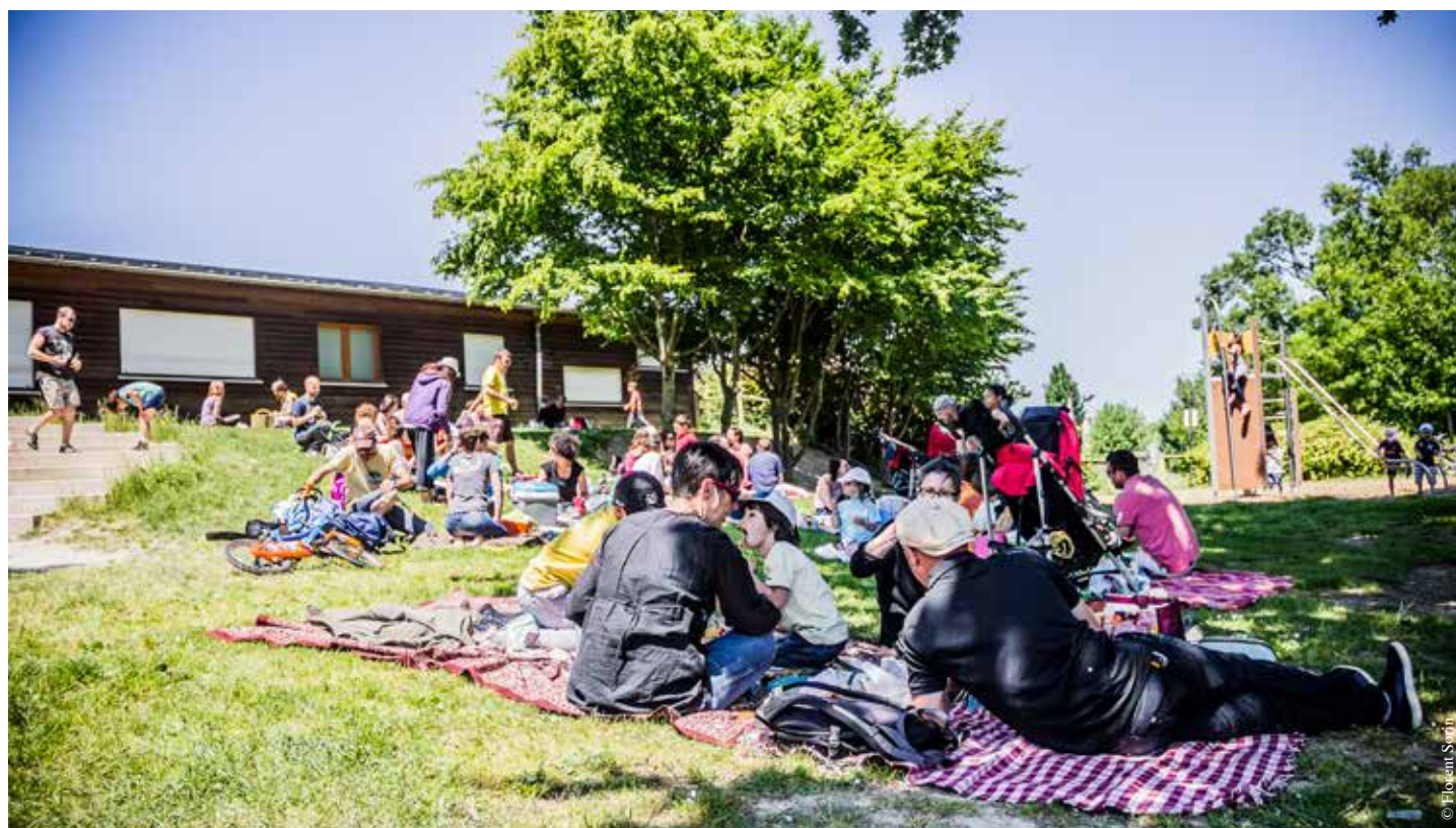
Détendez-vous en famille avec les Picnics sonores !

jour. Ils s'achèveront le dimanche 7 août à Rivoli pour vous permettre d'apprécier la fraîcheur de cet écrin de verdure et la chaleur de rythmes endiablés.