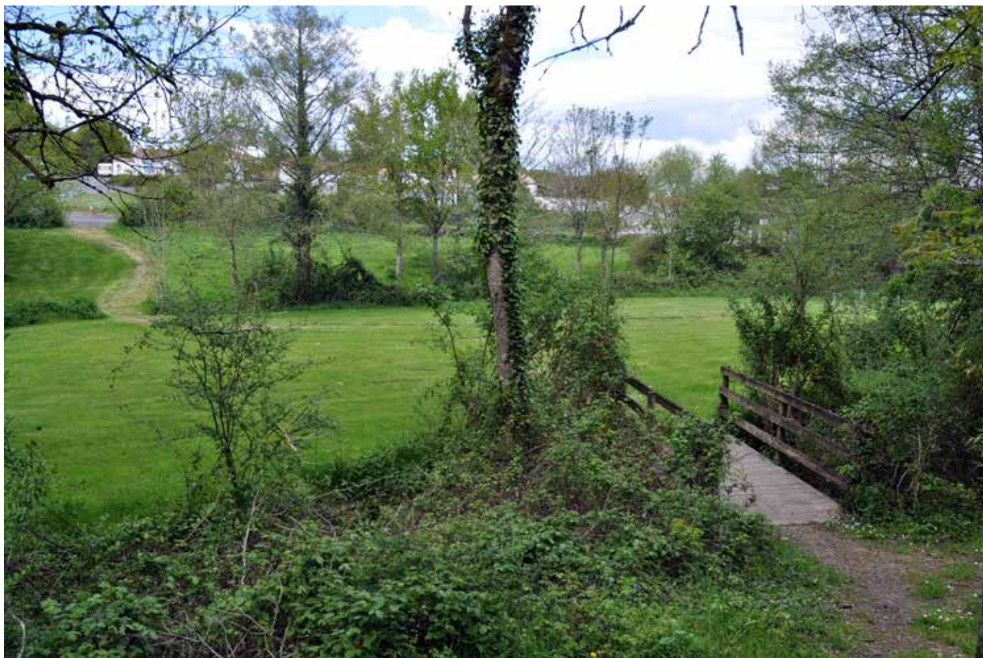
Le sentier passera par la vallée Verte.

La municipalité de Thorigny travaille actuellement sur un projet de sentier pédestre, aménagé et accessible à tous, agrémenté d'œuvres éphémères réalisées par des artistes locaux. Il devrait voir le jour à l'été 2017. L'appel à participation est lancé.