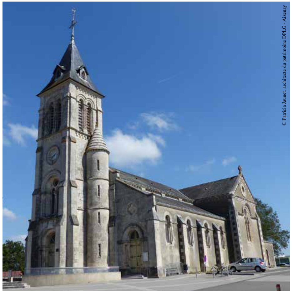
L'église Saint-Pierre de Nesmy, trésor de la période néogothique.

Contact : Fondation du patrimoine, délégation de la Vendée, 6 bis, rue des Arènes, Angers, au 02 41 19 77 39, à vendee@fondation-patrimoine.org et sur www.fondation-patrimoine.org/43225