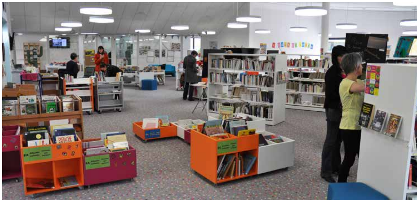
La médiathèque a intégré l'îlot des Arts.

et sur www.mediathèque-venansault.blogspot.fr