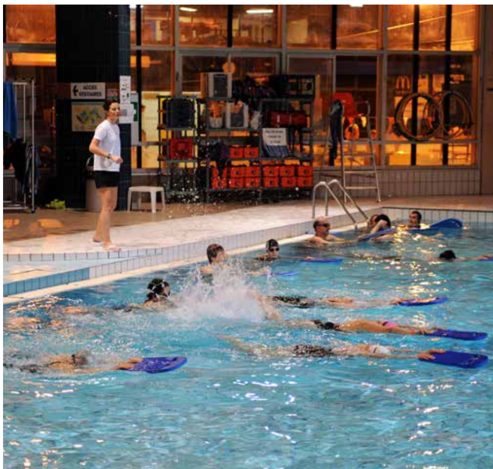
Choisissez vos cours collectifs dans les piscines de La Roche-sur-Yon Agglomération.