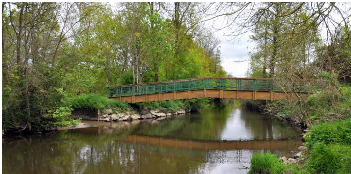
La passerelle du Furet sur l'Yon.

Depuis le 1 er janvier 2016, La Roche-sur-Yon Agglomération est passée de 15 à 13 communes. À l'instar de « Rives de l'Yon », née de l'association de Saint-Florent-des-Bois avec Chaillé-sous-les-Ormeaux, « Aubigny-Les Clouzeaux » a vu le jour suite à la fusion d'Aubigny avec Les Clouzeaux.