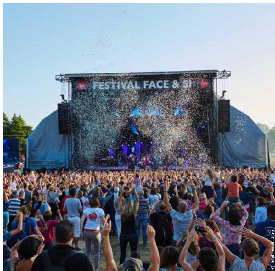
Ambiance garantie à Face & Si !

Le festival est soutenu par plus de 600 bénévoles répartis dans plus de vingt commissions