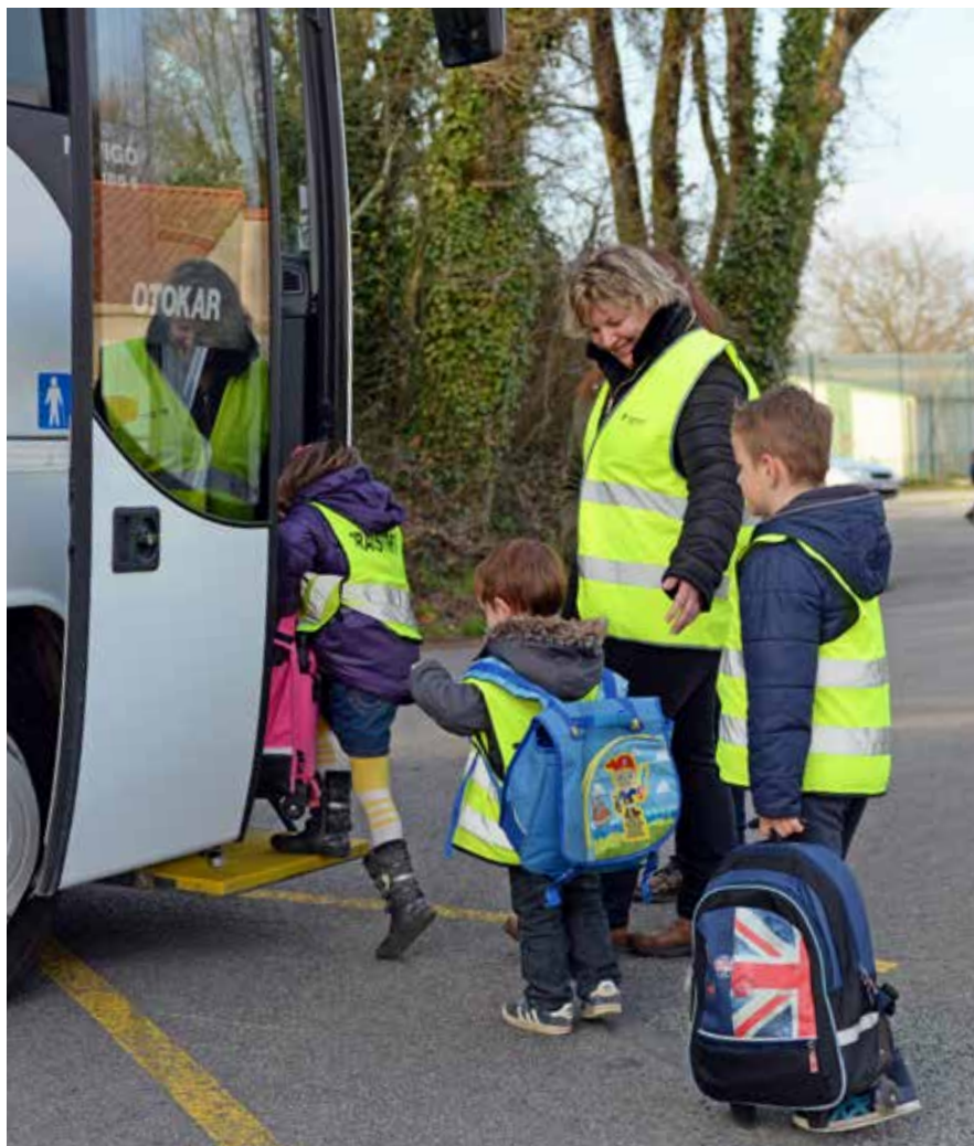
Vous avez jusqu'au 30 juin pour inscrire vos enfants au transport scolaire.

Les élèves domiciliés sur le territoire et scolarisés dans un établissement en dehors de l'agglomération ainsi que les élèves en situation de handicap doivent s'inscrire auprès du Conseil départemental de la Vendée.