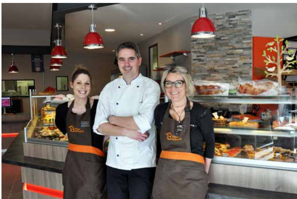
L'équipe de la boulangerie « Barbarit ».

Contact : « Maison Barbarit », 68, boulevard de l'Industrie – zone sud – La Roche-sur-Yon, au 02 51 94 04 00