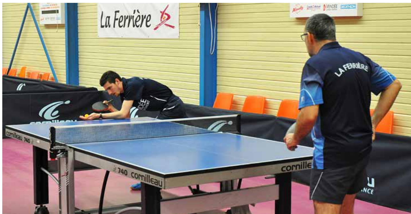
La Ferrière Vendée tennis de table possède sa propre salle au sein du complexe sportif depuis 1989.