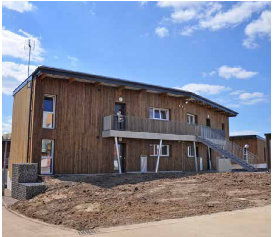
De longues coursives permettent la circulation des personnes à mobilité réduite dans l'ensemble de la résidence.

Coût du projet : 1,8 million d'euros (subvention de l'État 29 500 € ; subvention de La Roche-sur-Yon Agglomération 50 000 € ; fonds propres de Vendée Logement 562 170 € ; emprunt auprès de la Caisse des dépôts 1 196 392 €.