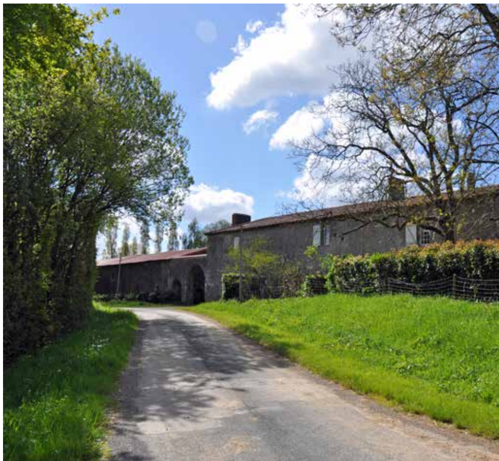
Balade au cœur du patrimoine de Fougeré.

plus d'informations sur www.fougere.fr .