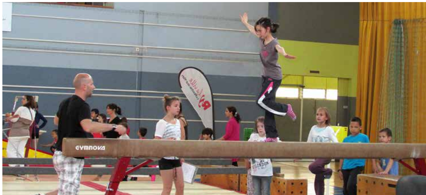
Les écoliers de La Roche-sur-Yon peuvent découvrir la gymnastique grâce au GCRY.

D u lundi 20 au vendredi 24 juin à la salle omnisports de La Roche-sur-Yon, près de 1 400 écoliers yonnais participeront à la 22 e édition du challenge Georges-Clergeaud, du nom de l'ancien dirigeant et animateur du Gymnastique club de La Roche-sur-Yon (GCRY) décédé en 1994.