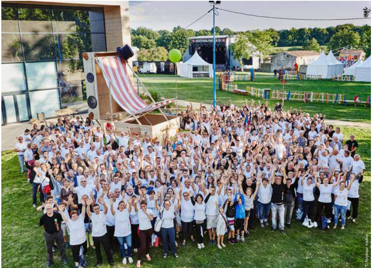
Plus de 600 bénévoles participent à la bonne marche du festival Face & Si.

chargées d'organiser toute la logistique de la manifestation : bar, restauration, parking, nettoyage du site, décoration... L'atelier Face & Si recherche notamment des volontaires pour créer la décoration du festival, dans une ambiance conviviale. Lors de la précédente édition par exemple, les bénévoles de l'atelier