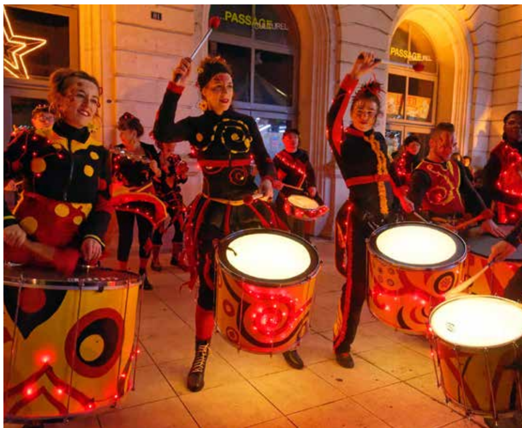
Ambiance brésilienne avec la compagnie Capharnaüm.

Contact : 02 51 40 37 76, sur Facebook Festival des arts de la rue Les Clouzeaux et www.lesclouzeaux.fr