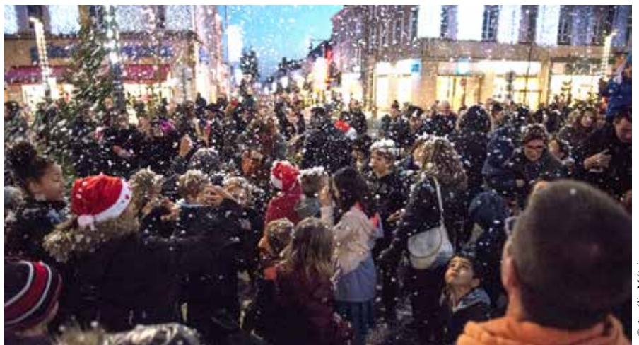
Dans un cœur commerçant noir de monde, les «flocons de neige» ont fait la joie des enfants.