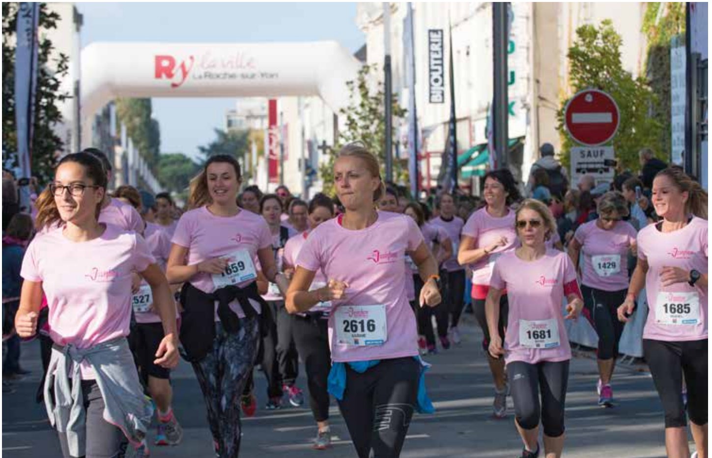
La « Joséphine », qui a rassemblé 3 000 coureuses et marcheuses contre le cancer, sera reconduite.

maîtriser nos dépenses de fonctionnement et dégager de nouvelles ressources financières : réduction des charges à caractère général (600 000 euros sur l'ensemble des services municipaux concernant les dépenses de fourniture, d'électricité...); soutien aux associations à hauteur de 95 % de l'enveloppe 2015..., sans oublier la maîtrise des charges de personnel : elles représentent près de 60 % de nos dépenses réelles de fonctionnement. Pour les contenir, nous limitons les créations de postes en 2016, conformément à nos engagements. Les seules créations concerneront la Police municipale (recrutement de trois policiers) et l'éducation (postes d'animateurs pour répondre aux nouvelles règles d'encadrement fixées par l'État – aux frais des communes ! – concernant les rythmes scolaires). La mise en place du schéma de mutualisation (transferts de personnels entre la Ville et l'Agglomération) doit également nous permettre de réduire nos coûts de fonctionnement.