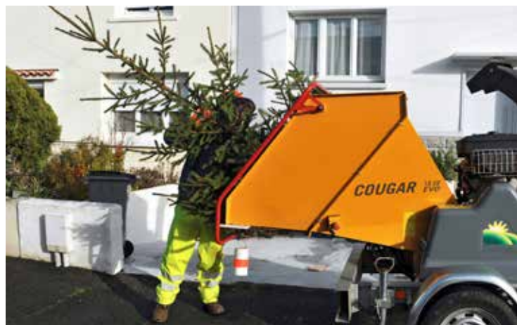
Vos sapins seront transformés en broyat.