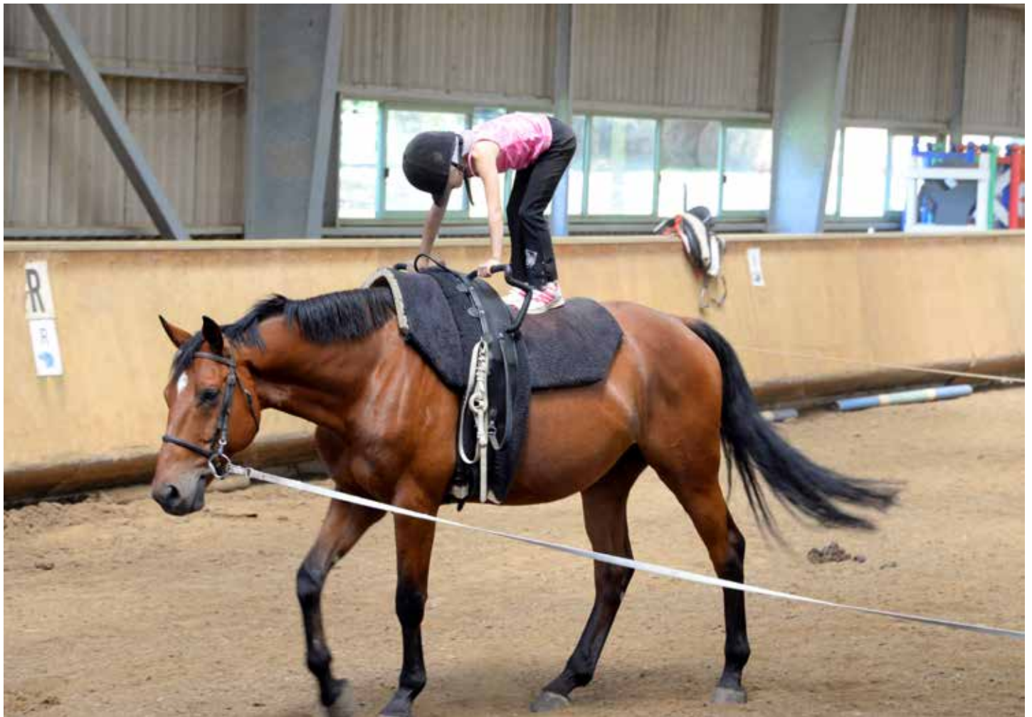
Des activités sportives pour les 7-13 ans.

Pour permettre à tous les petits Yonnais de pratiquer des activités sportives, la Ville de La Roche-sur-Yon organise « Sport vacances hiver » du 15 au 19 février.