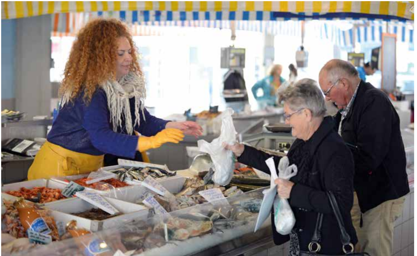
Pour une redynamisation du quartier des halles.