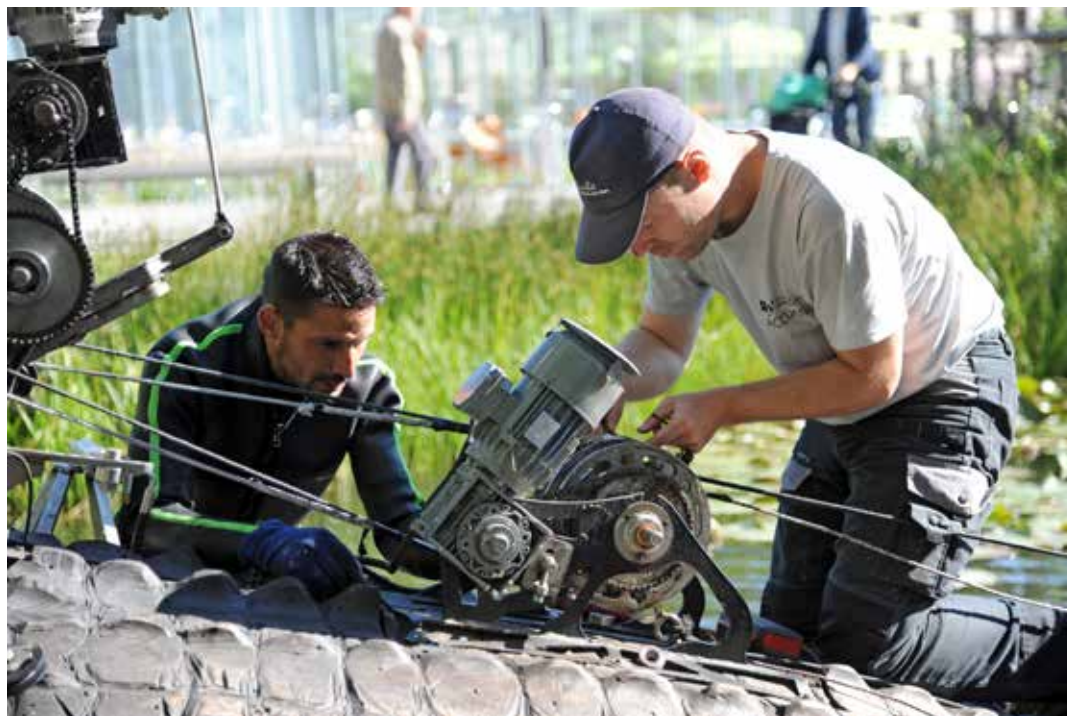
Les « vétérinaires » bichonnent les Animaux de la place.