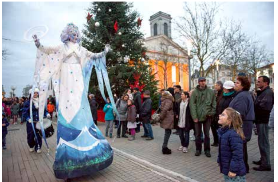
Près du sapin décoré par les enfants, les Saintes de glace ont déambulé avec grâce.