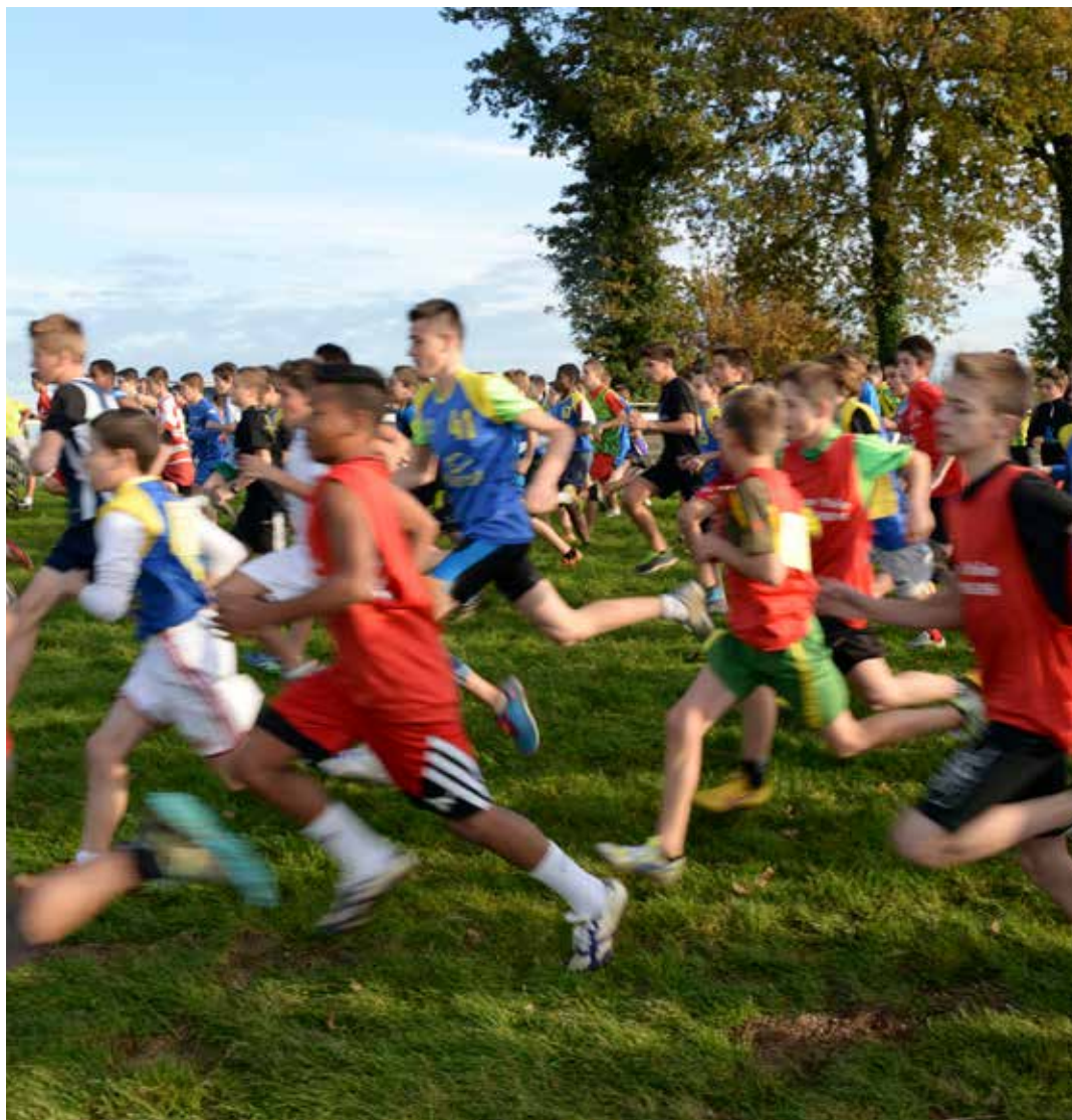
Des courses pour tous les âges.

Contact : ACLR, au 02 51 37 98 17 et à aclry85@gmail.com