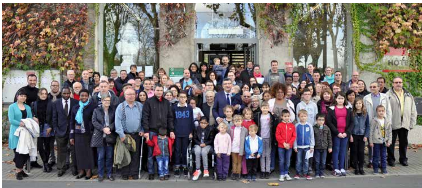
Un millier de nouveaux habitants s'installe chaque année à La Roche-sur-Yon.

La visite s'est achevée en mairie par un échange avec les élus et une présentation des services de la collectivité.