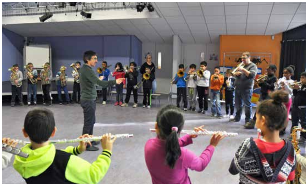
Séance de répétition de l'orchestre à l'espace Golly.

leur famille, qui s'engage à en prendre soin.