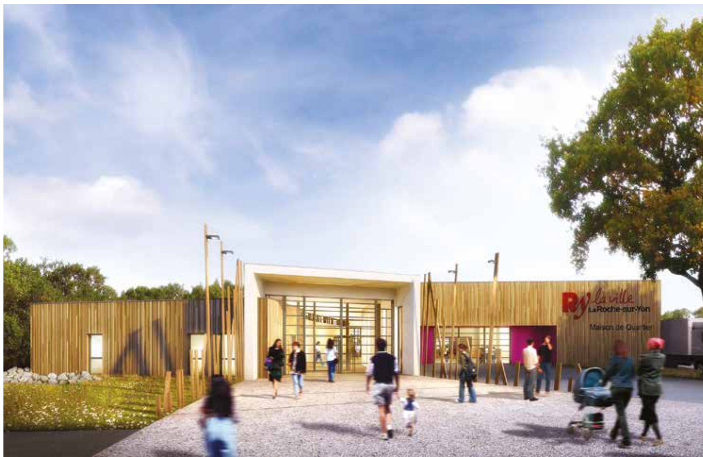
La future maison de quartier du Pentagone/Pont-Morineau permettra aux associations d'organiser davantage d'activités que dans leurs anciens locaux, trop vétustes, mais aussi de faciliter les échanges avec les habitants des alentours (Zola, Salengro, Montjoie...).

Favoriser la vie de quartier, animer durablement le centre-ville, soutenir les commerces de proximité, offrir de bonnes conditions d'apprentissage aux écoliers, favoriser l'accès de tous aux activités sportives et culturelles, faire de La Roche-sur-Yon une ville où il fait bon vivre : tels sont les objectifs des actions menées par la Ville.