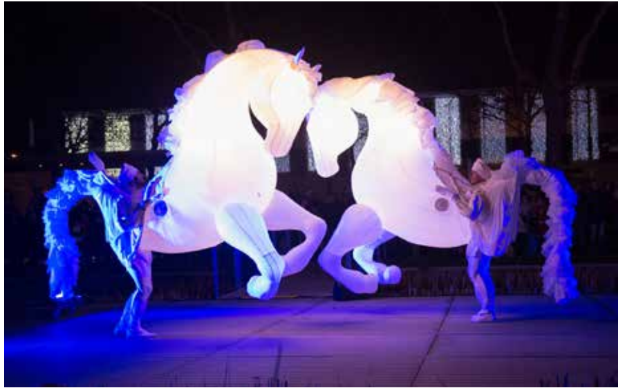
La féerie des Fiers à cheval a émerveillé petits et grands.