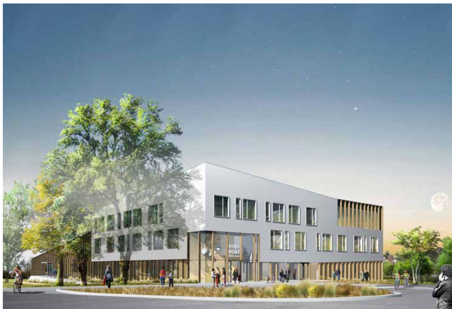
Le futur groupe scolaire Pont-Boileau, un bâtiment haute qualité environnementale relié à l'internet haut débit.

« Nous devons dégager suffisamment d'épargne pour mettre en œuvre notre programme pluriannuel d'investissement : nous allons investir pas moins de 150 millions d'euros d'ici à 2020. Par ailleurs, nous devons garantir la pérennité d'un service public de qualité. Avec ces ambitions, nous devons faire mieux avec moins ! Nous avons donc décidé de mettre en place des mesures pour