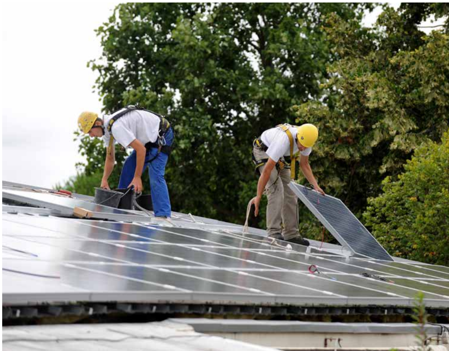
Des aides pour augmenter la proportion d'énergie renouvelable sur le territoire.

Le reste des financements ira à la Communauté de communes Vie et Boulogne pour l'extension de ses locaux et aux communes du Pays Yon et Vie pour l'achat d'un véhicule électrique et de vélos à assistance électrique.