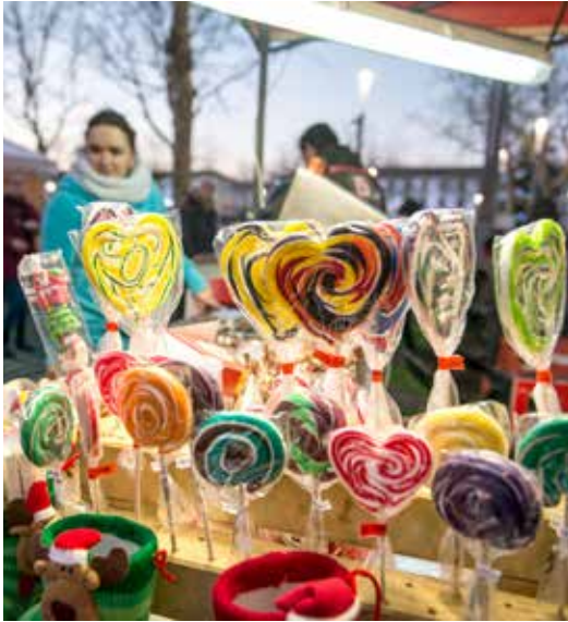
Les chalets gourmands et le marché des créateurs ont ravi les promeneurs.

Spectacles féeriques, marchés gourmands et des créateurs, village du père Noël, ateliers ludiques, balades à poney et navettes en calèche..., vous avez été nombreux à profiter des multiples rendez-vous de Noël en fête du 12 au 23 décembre dernier. Plus d'images sur www.ville-larochesuryon.fr .