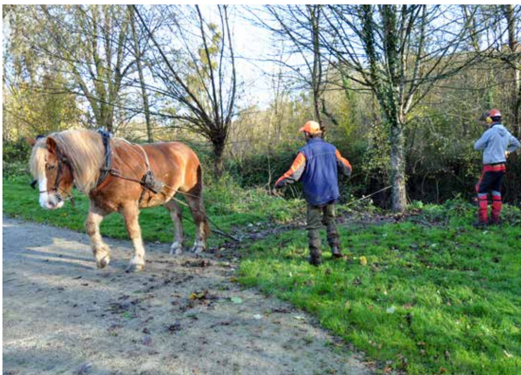
Ondine, superbe jument de trait, n'a pas ménagé sa force.

Pour évacuer les troncs, l'Agglomération a fait appel à Ondine, une superbe jument de trait. Une méthode écologique qui permet de préserver les berges et qui fait le plaisir des promeneurs.