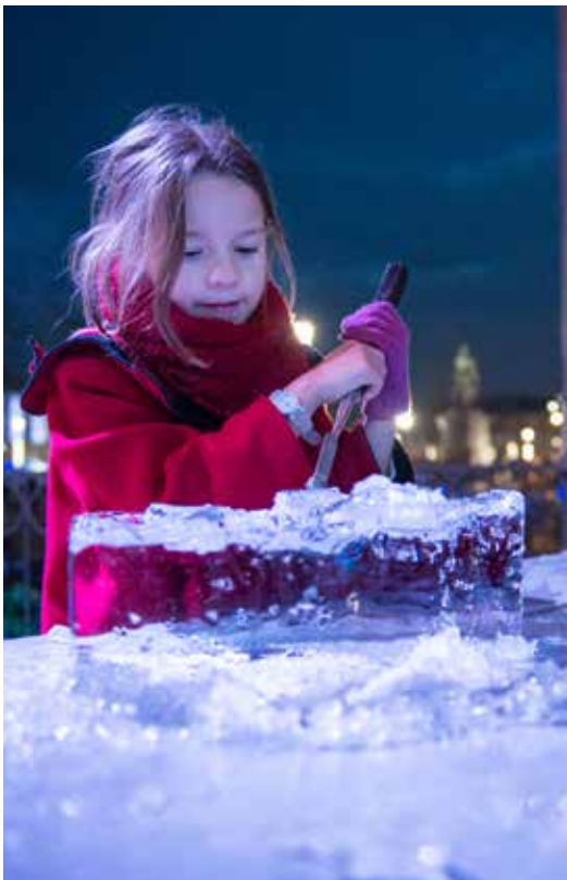
De nombreuses animations pour toute la famille étaient proposées, comme la sculpture sur glace.