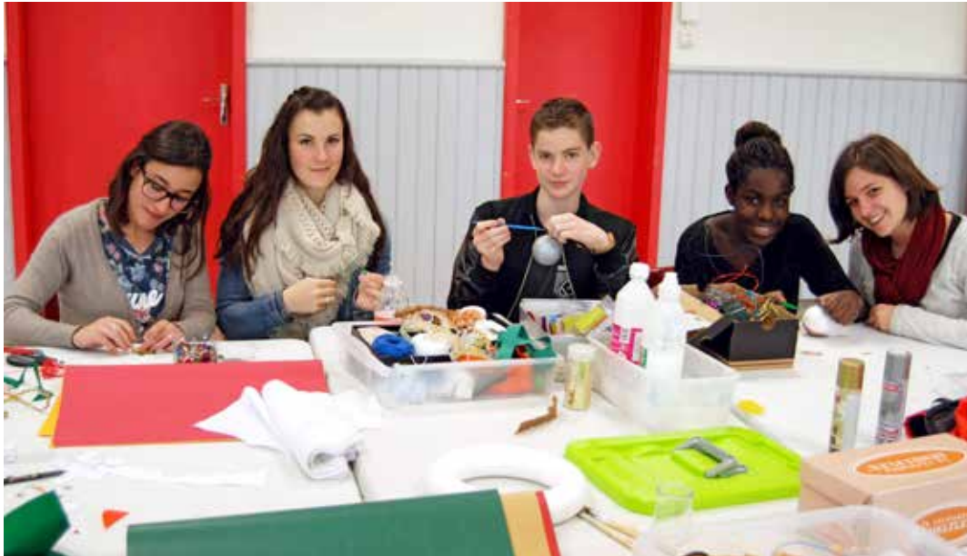
L'atelier réalise la décoration du sapin de Noël en bois.

Cet été, par exemple, les habitants ont reproduit des œuvres de Picasso pour décorer le petit bois et ont fabriqué un hôtel à insectes, une roue musicale et des poupées russes. Fin 2015, ils se sont attachés à customiser des bancs et des barrières.