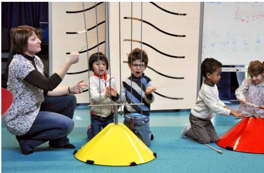
Les structures Baschet, du nom de leur créateur, sont de drôles d'instruments très colorés, bien adaptés à l'éveil musical des petits.

En amont de ces séances, l'école maternelle avait effectué un travail avec les enfants sur le conte musical « Pierre et le loup ». De janvier à mars 2016, ce travail se prolongera par des visites au Conservatoire pour présenter aux écoliers les diverses familles d'instruments classiques.