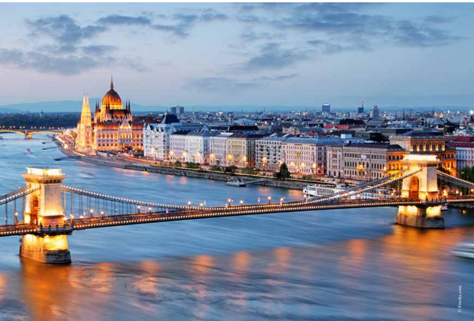
Vue sur le Parlement de Budapest et sur le Danube.

Contact : inscriptions au 02 51 36 05 22