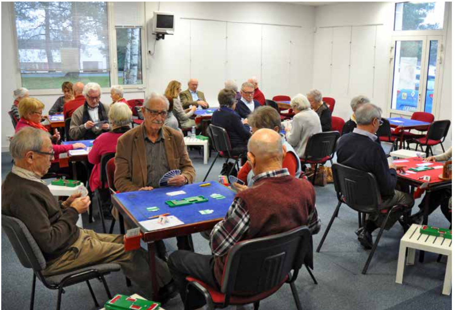
La Roche Trèfle Loisirs vous accueille dans les locaux du Bridge club.

Contact : La Roche Trèfle Loisirs, au 02 51 37 14 72