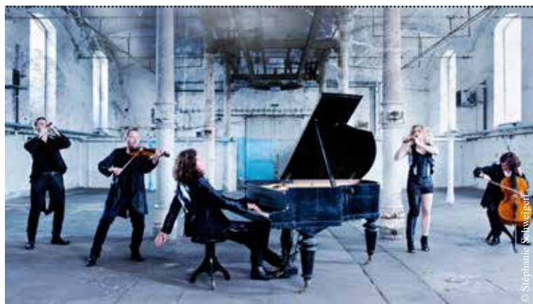
Spark - The Classical Band

Retrouvez l'ensemble de la programmation dans les pages du Sortir.